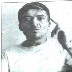
PEDRO ALFONSO LOPEZ, el 'Monstruo de los Andes'