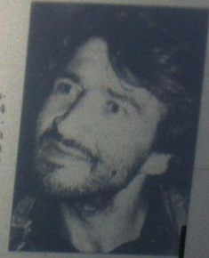
PEDRO ALFONSO LÓPEZ asesino en serie colombiano.

Mientras tanto, la población en la zona fronteriza