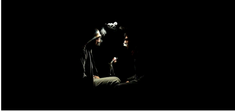
Conversación, fotograma, José Luis Triviño, 2014, video

En este video la forma y la materia asumen la disposición de modular el cuerpo, y sus cualidades mismas son cuestionadas, la carne, cuando se comporta como algo distinto nos permite aproximarnos a ella desde otro punto. Las concepciones que tenemos de las cosas pueden variar súbitamente si encontramos una interpretación que consideremos mas acertada, cuando algo no esperado sucede el espectador busca entender que ocurre y empieza a generar especulaciones lo que lo motiva a esperar que algo mas suceda o a buscar algo que le diga que sucedió.