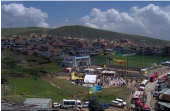
PARQUE ILLIMANI INTERVENCION EXISTENTE