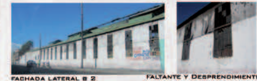
FACHADA LATERAL B 2 FALTANTE Y DESPRENDIMIENTO

LOS EDIFICIOS 1, 2, Y 3 HAN TENIDO UN DEBIDO MANTENIMIENTO Y, SI BIEN SUFREN DE DETERIOROS, ESTOS NO SON GRAVES Y SON LOS DETERIOROS NORMALES DEL MATERIAL. PARA ESTOS SE PROPONE ACCIONES COMO PRIMEROS AUXILIOS, LIMPIEZAS, DESINFECCIÓN, DESECACIÓN, DESALINIZACIÓN, UNIONES DE FRAGMENTOS, CONSOLIDACIÓN, FIJADO, RESTITUCIÓN DE PARTES O FALTANTES, REMOCIÓN DE MATERIALES PATÓGENOS, RESANES Y AGREGADOS ENTRE OTROS. ESTAS ACCIONES DIRECTAS SOBRE LOS BIENES VAN ORIENTADAS A ASEGURAR SU PRESERVACIÓN A TRAVÉS DE LA ESTABILIZACIÓN DE LA MATERIA. POR OTRO LADO, LA FALTA DE MANTENIMIENTO DE LOS EDIFICIOS 4, 5, 6 Y 7 HICIERON QUE ESTOS SE ENCUENTREN EN UN GRAVE PELIGRO DE DERRUMBE, POR LO QUE SE PROPONE PARA ELLOS SU DEMOLICIÓN DEBIDO AL RIESGO QUE REPRESENTA MANTENERLOS EN EL ESTADO QUE ESTAN Y QUE YA NO ES POSIBLE LOGRAR SU ESTABILIDAD.