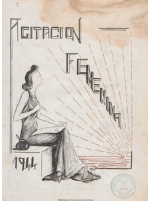
Figura 1. Portada de la Agitación Femenina