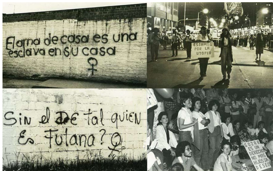
Figura 3. Movimientos feministas 1985

Querer ser feminista requiere de un trabajo doble, es un camino donde hay un sin fin de posibilidades de perderse en el trayecto, de fallar porque resulta demasiado complejo, en un país tan laico, la consigna de: Te juzgo por ser feminista pero si dejas de serlo fue un juego para ti ; es un peso que deben cargar aquellas mujeres que se declaran abiertamente parte del movimiento. De esa misma forma la mayoría de mujeres que apoyan la ideología tuvieron que pelear contra sí mismas en costumbres que les hacían daño, debían luchar contra los demás para hacerles