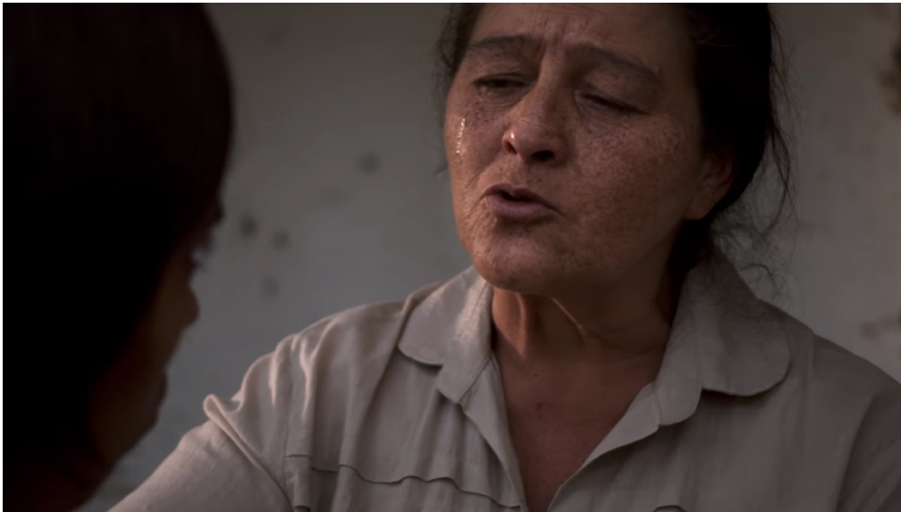
Figura 4. Escena película La mujer del animal del director Víctor Gaviria

Otra experiencia que se compartió en el conversatorio fue la de una mujer de edad, que cuenta la historia de cuando se quedó huérfana, un tío decidió recogerlas y llevarlas a su casa, desde que esta mujer tiene cuatro años es violada por este hombre quien tiene como cómplice a su esposa, hasta que un día decide escaparse porque se da cuenta que esta clase de abusos no son normales, meses más tarde da a luz su segundo hijo producto de las violaciones, casos como este hay miles en Colombia. (Desconocido, 2018)