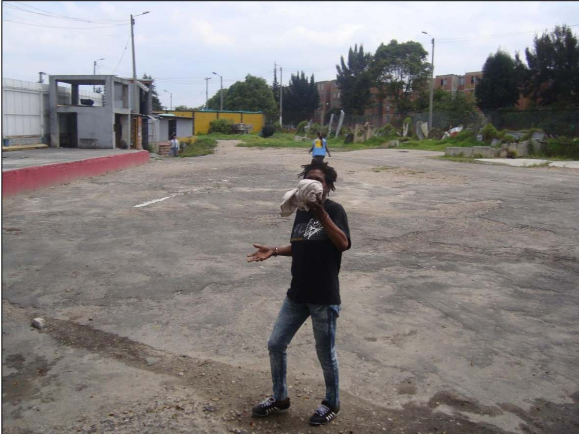
Cuerpo sin rostro listo para retornar a la calle después de un día de “patio”.