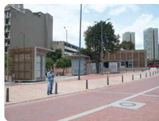
Espacio Público Conformado 15