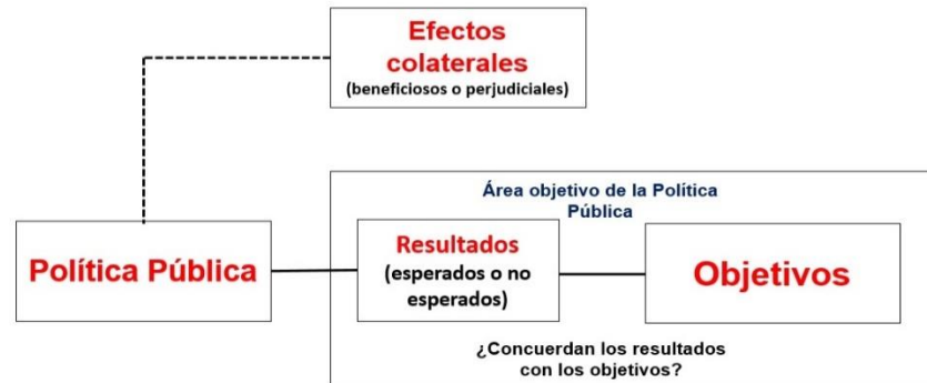
Gráfica 1. Efectos colaterales según