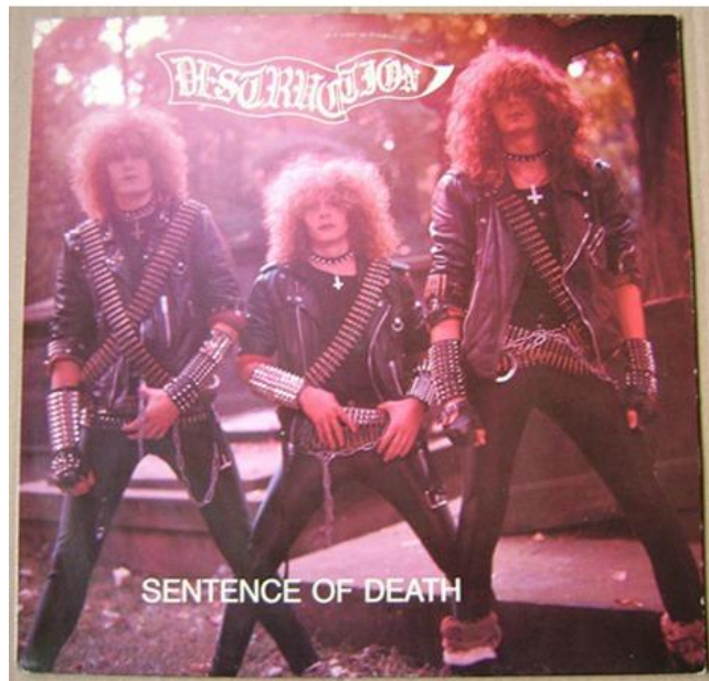
Destruction Sentence of death (1984)