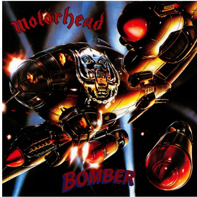
Motorhead Bomber (1979)