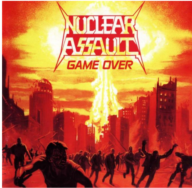
Nuclear Assault Game over (1986)