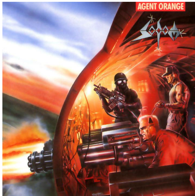
Sodom Agent orange (1989)

En el año de 1983 nace en Medellín la primera banda producto de la llegada e influencia cultural de la música metal en Colombia, y a la cual la gente para ese entonces la consideraría como la banda con el sonido más pesado, oscuro y extremo en el país: