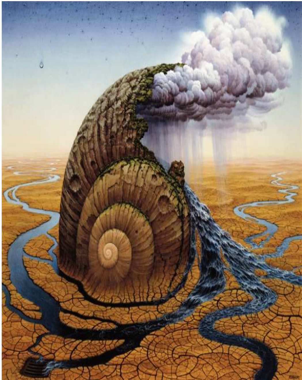
YERKA. Yacek. The second day of Genesis. [En línea] Glicee N° 43. S.f. [Recuperado el 30 de junio de 2009] Disponible en Internet: http://www.yerkaland.com/glicee.php?act=0&od=24&do=35&x=3