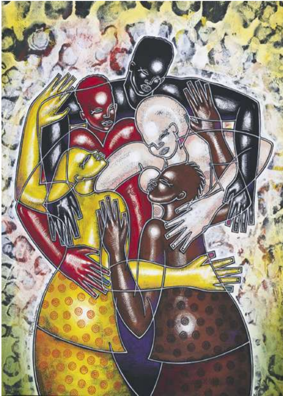
PONCHO. Larry. Inclusión. [En línea] Larry Poncho Brown. S.f. [Recuperado el 30 de junio de 2009] Disponibile en Internet: http://www.larryponchobrown.com/images/Art%20of%20Inclusions.jpg