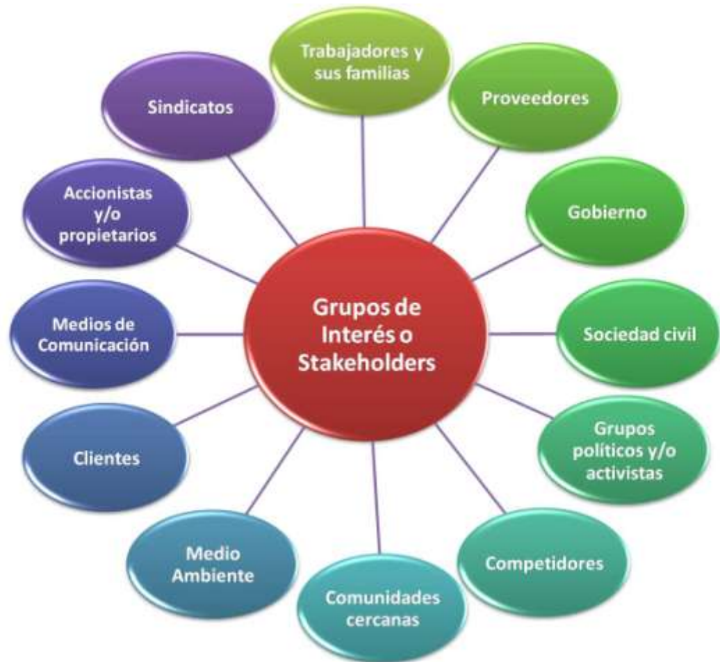
GRÁFICO GRUPOS DE INTERÉS O STAKEHOLDERS

Título: Grupos de Interés o Stakeholders. Elaborado por: Cuervo Prados, Andrea. 2009