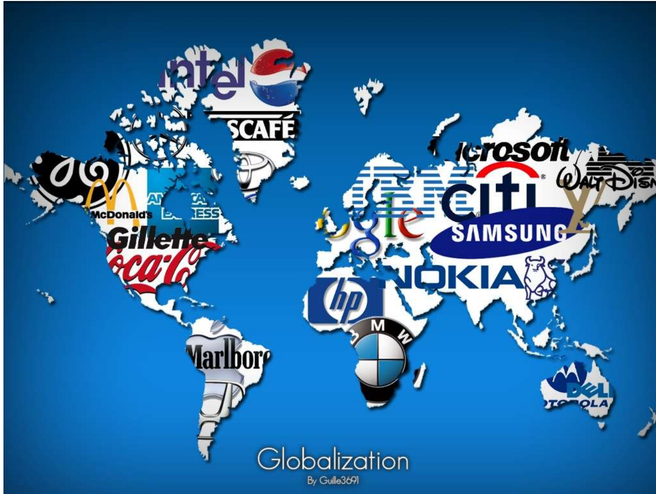
GUILLE. Globalization. [Imagen] s.d.: [En línea] [Recuperado el 30 de Junio de 2009] Disponible en Internet: http://fc01.deviantart.com/fs24/f/2008/013/c/f/Globalization_by_Guille3691.png