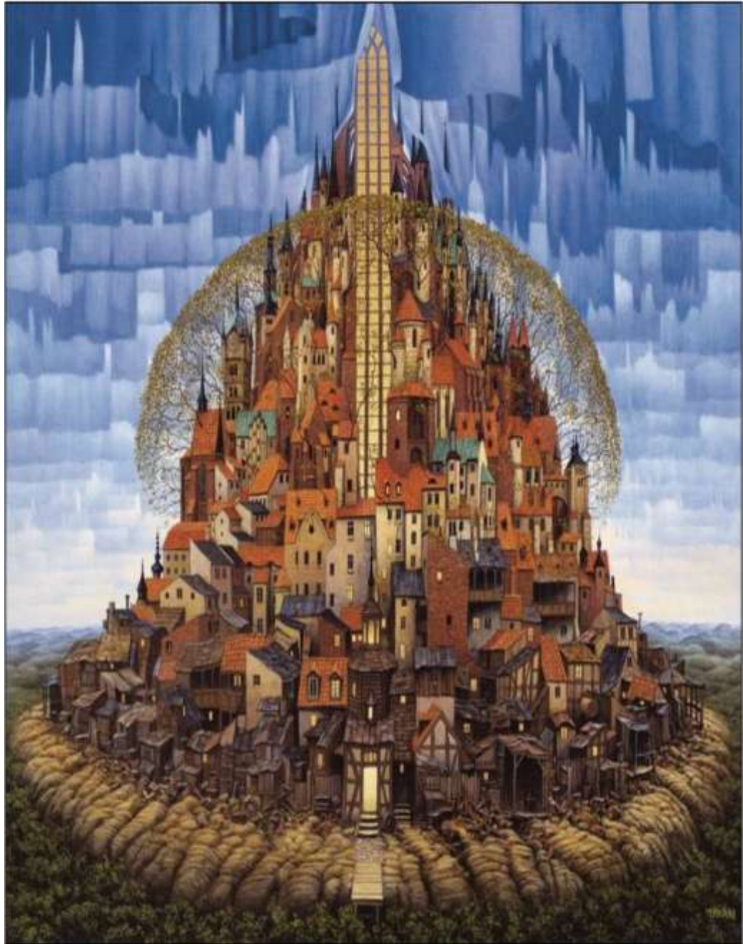
YERKA. Yacek. Spring comes to the parish. [En línea] Glicee N° 121. S.f.[Recuperado el 30 de junio de 2009] Disponible en Internet: http://www.yerkaland.com/giclee.php?act=0&od=72&do=83&x=7