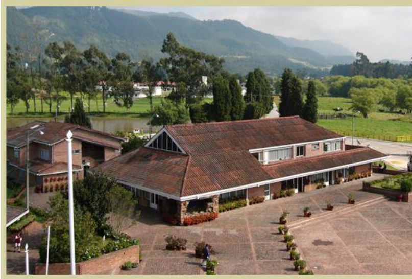
Centro de Orientación Juvenil Luis Amigó, Cajicá