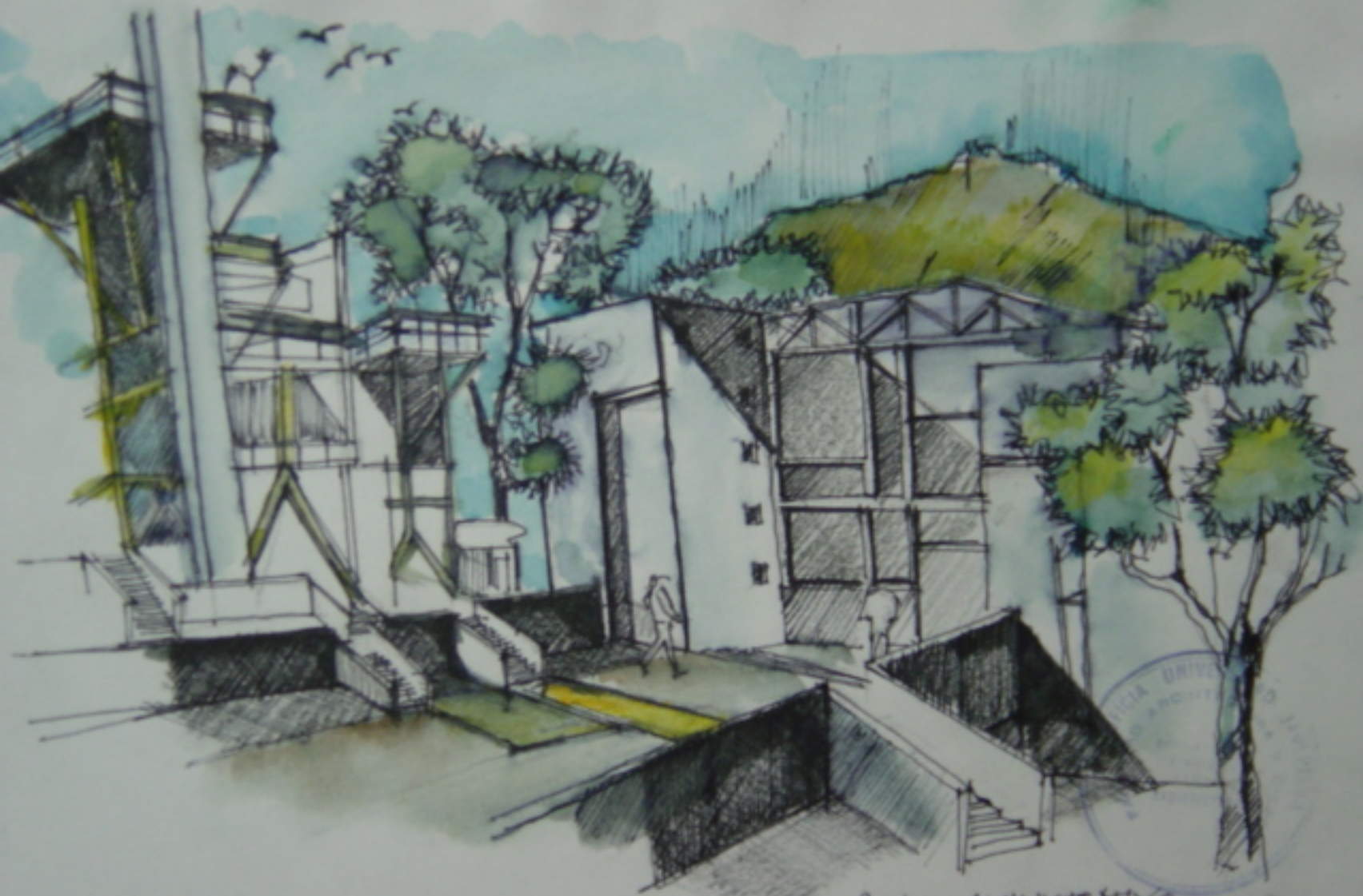
CENTRO ADMINISTRATIVO MUNICIPAL