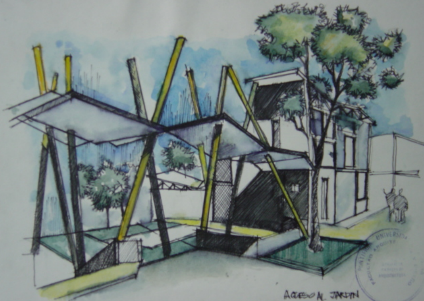
ACCESO AL JARDIN ARQUEOLOGICO.