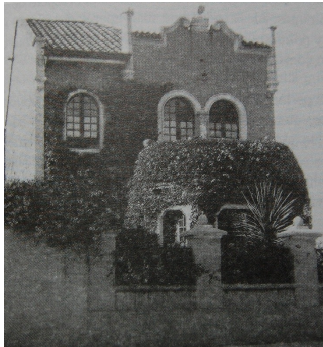
Casa Gaitán estilo ecléctico

La casa localizada en el barrio de Santa Teresita fue comprada en los años 30 por Gaitán con el fin de vivir con su madre, esta casa implantada en un lote alargado de dimensiones moderadas y estilo ecléctico, hace parte de los desarrollos urbanos de vanguardia en Bogotá, donde aparecen las instalaciones de luz, agua potable y alcantarillado.