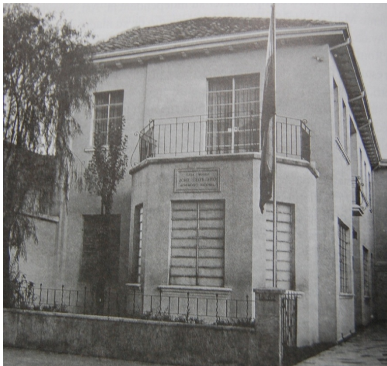
Casa Gaitán remodelada de estilo moderno Gaitán Jaramillo, gloria, Bolívar tuvo un caballo blanco, mi papa un buick

La casa de dimensiones más generosas, se localizaba en el costado oriental de la avenida caracas, la casa de estilo academicista, fue rechazada por Gaitán, debido a sus dimensiones y ostentosisidad. Por lo cual decide remodelar su casa en el barrio de santa teresita, proyecto entregado a Santiago de la mora.