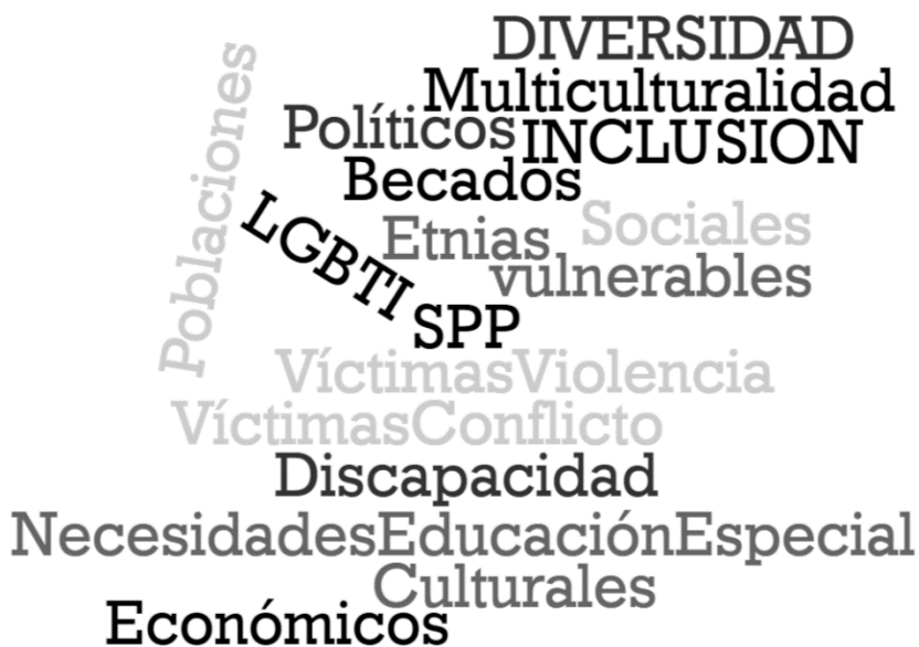
Figura 2 Elementos de la diversidad estudiantil identificados en la Javeriana