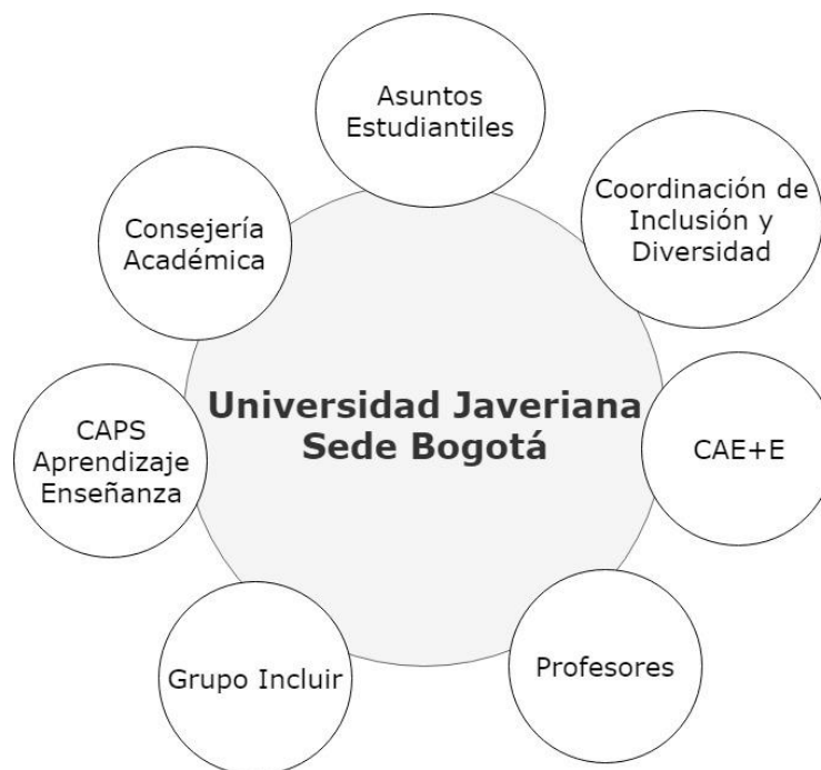
Figura 3 Unidades que apoyan estrategias de acompañamiento en la PUJ frente la diversidad y la inclusión estudiantil