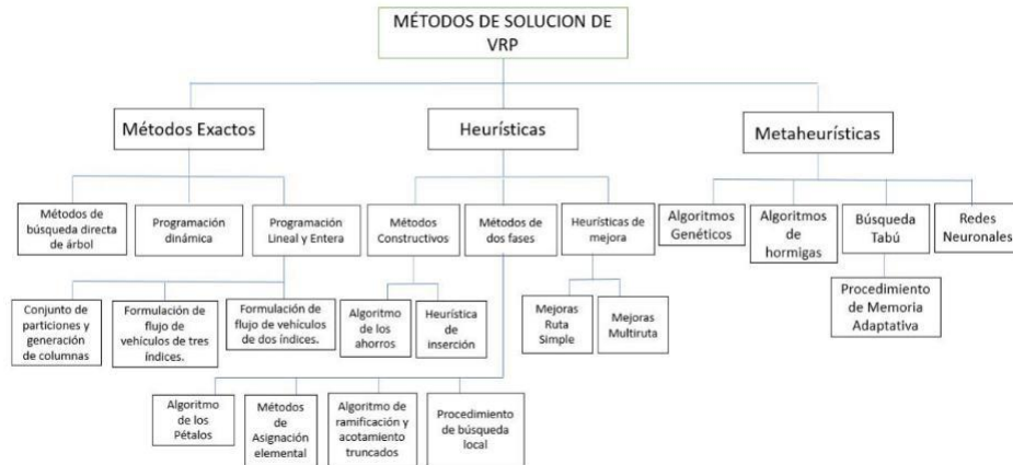
Ilustración 2. Métodos de solución de VRP.(Elaborado por los autores)

En los últimos 20 años los VRPTW han sido ampliamente abordados por varios investigadores. Las diferentes publicaciones a lo largo de los años mencionan tres métodos de solución, exactos, heurísticas y metaheurísticas. (Ilustración 2).