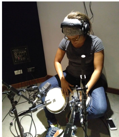
Ilustración 17. Grabación de bongó. 2019