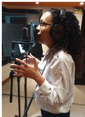
Ilustración 9. Grabación coros “Nuestro hogar”

La grabación de la voz principal tomó lugar en el estudio B en cinco sesiones diferentes .