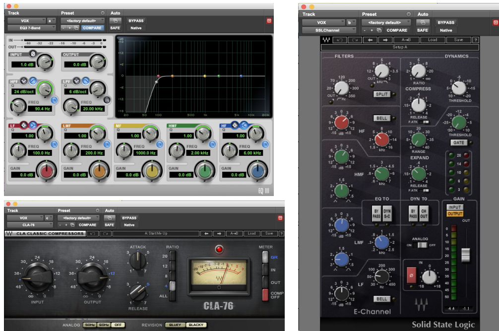
Ilustración 10. Mezcla voz principal