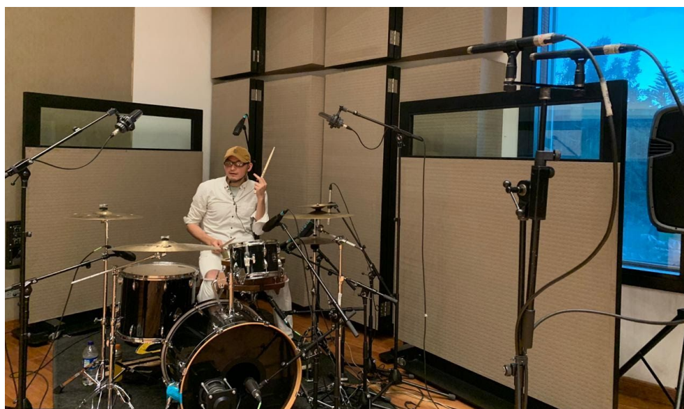
Ilustración 5. Grabación de batería, vista general.

El reto más grande de grabar la batería de 3 temas del EP estaba en la unidad que se pretendía lograr en la producción general de los temas. La batería es uno de los elementos unificadores más importantes de las canciones ya que con este se pretende acoplar las diferentes fusiones del EP dentro de una misma estética.