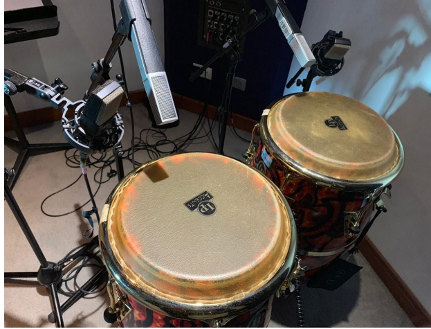
Ilustración 16. Grabación de congas. 2019