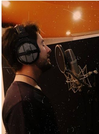
Ilustración 8. Grabación voz principal

Era muy importante realizar una prueba de micrófonos con diferentes referencias antes del día de grabación (Shure SM7B, AKG 414, M-audio Sputnik, Neumann U87, Mojave MA300), para determinar cuál era la mejor opción que se ajustara a los propósitos sonoros. El micrófono utilizado para esta ocasión fué el Neumann U87, ya que su respuesta en frecuencia en el eje es plana, tiene un sonido natural y una buena presencia en el rango medio, lo que hace que se acople al sonido cálido original de la voz que se buscaba en las canciones.