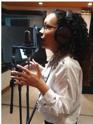
Ilustración 21. Grabación voces “Nuestro hogar” 2019