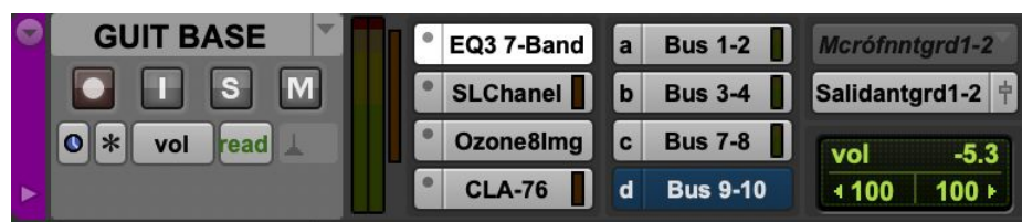
Ilustración 12. Mezcla guitarra