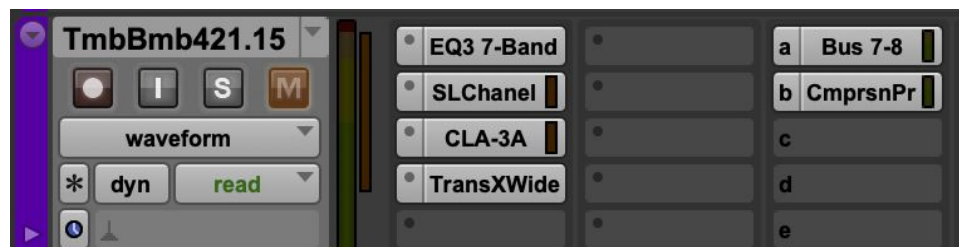
Ilustración 14. Mezcla bombo tambora