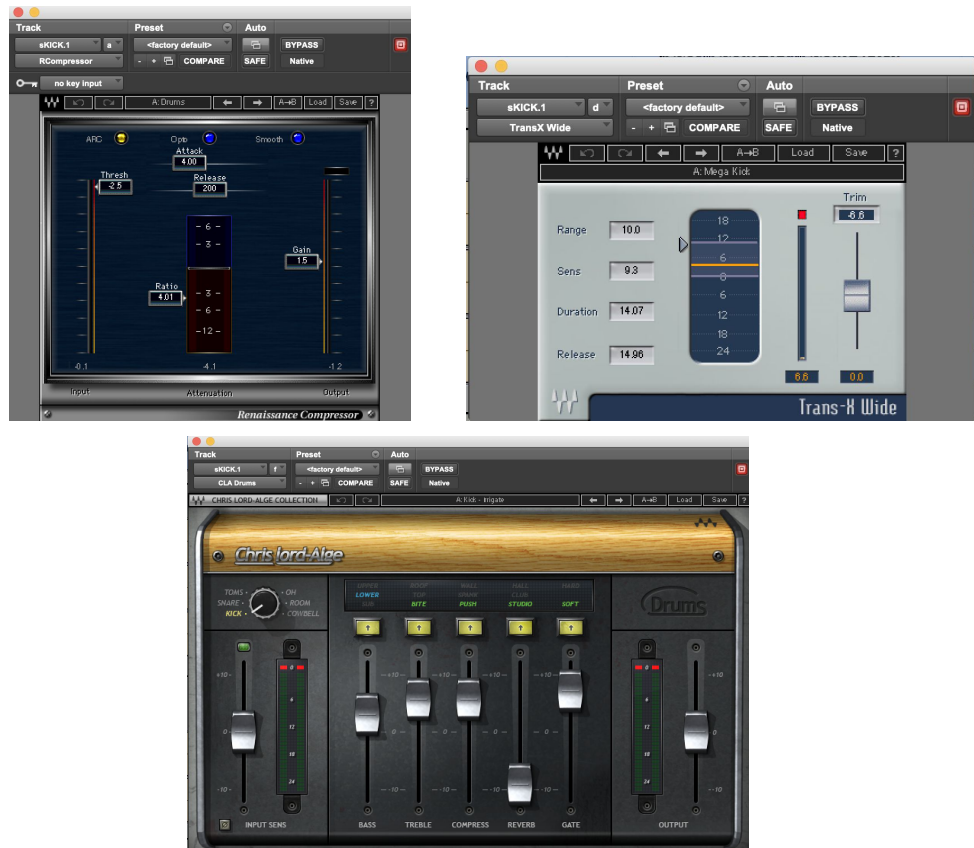
Ilustración 13. Mezcla batería