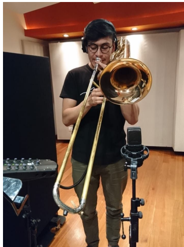
Ilustración 20. Grabación trombón de “Lo terrenal” 2019