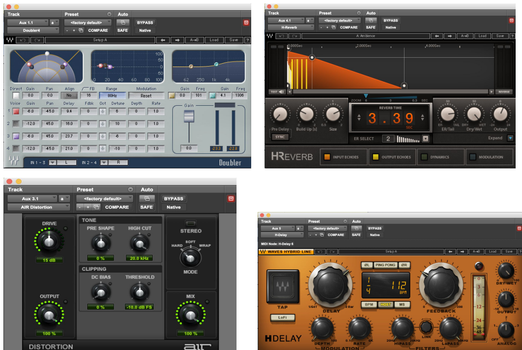
Ilustración 11. Mezcla voz principal