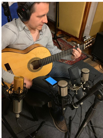
Ilustración 7. Grabación guitarra “Eso eres”

En el caso de la guitarra acústica solista de “Eso eres”, los micrófonos usados fueron: