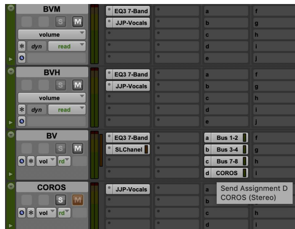
Ilustración 15. Mezcla coros

Más adelante, en la canción, se empieza a abrir la imagen estéreo en los coros para crear esa sensación de “masa” semejante al canto de todo un pueblo. Para esto fue necesario dividir las voces masculinas y femeninas en 2 auxiliares. Allí se insertaron el EQ3-7 para limpiar frecuencias, y el JJP-Vocals para darle el color a cada grupo de voces. Estos canales salen a un auxiliar de coros con un SSL Channel para dar unidad y con unos envíos de doubler, H-Reverb, Distorsión y H-Delay.