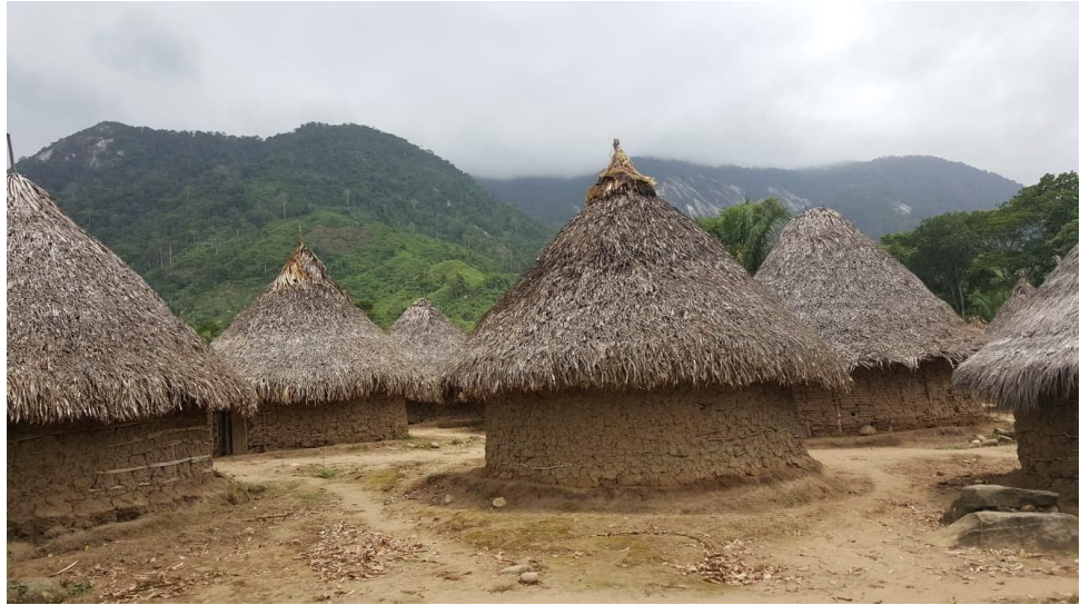
Imagen I. Pueblo Kogui Tugeka.