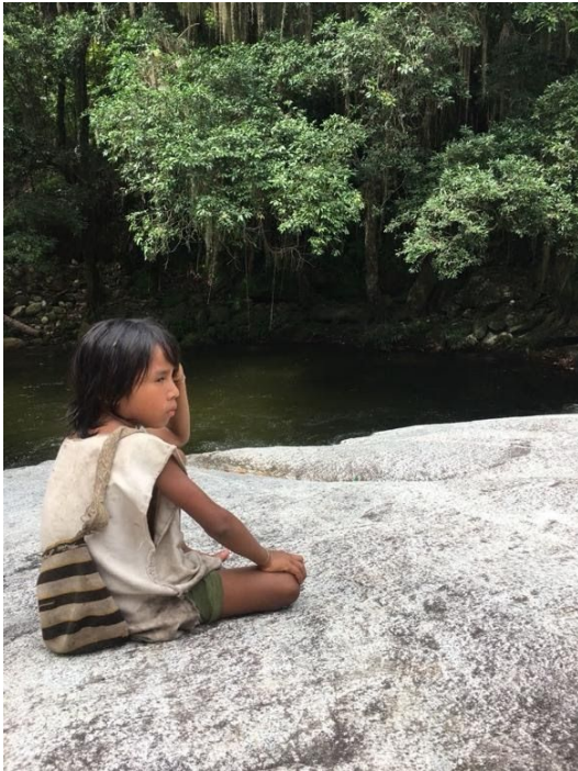
Cambalache en la orilla de Río Ancho