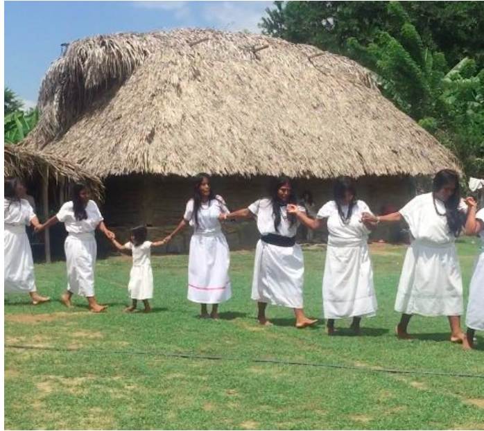
Mujeres Arhuacas llevando a cabo un baile tradicional

Luego, me desplazé a la ciudad de Valledupar con la intención de encontrar representantes de los cuatro pueblos que pudieran darme una visión más articulada sobre el proceso de negociación y construcción del decreto 1500/18. Me encontré con una casa indígena muy similar a la existente en Santa Marta, donde logré tener entrevistas con diferentes líderes Arhuacos, quienes eran los más presentes dentro de la casa y los encargados de liderar todos los procesos de consecución y desarrollo de proyectos para las comunidades indígenas. Entrevistas realizadas tanto dentro del recinto, al lado de los demás asistentes y auxiliares de las organizaciones indígenas, y en oficinas donde se situaban Arhuacos para el desarrollo de sus labores comunitarias, como en áreas comunes al lado de plantas de coca, y personas que constantemente estaban mambeando y poporeando mientras hablaban en su propia lengua con sus compañeros.