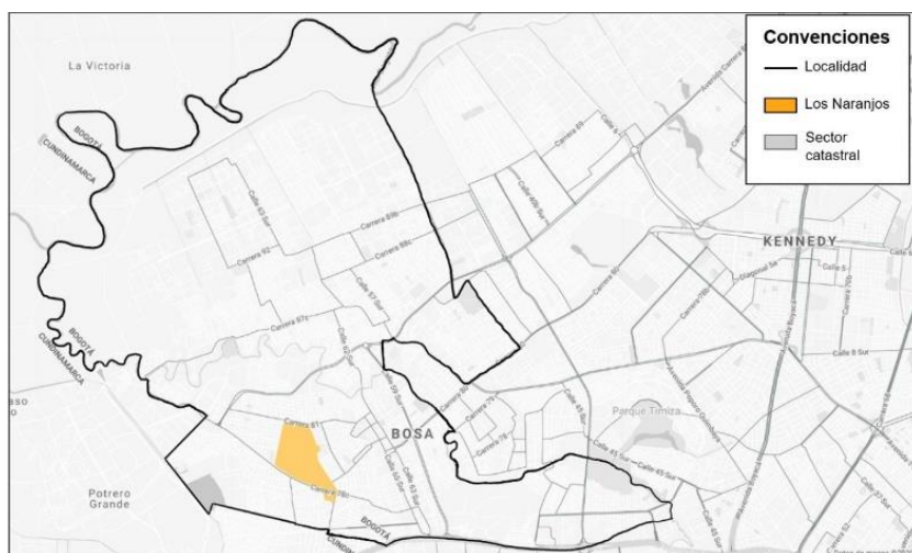
Imagen 1. Localización Bosa Naranjos-El Retazo dentro de la localidad 7 de Bogotá

avenida conocida como “las Torres” (por hallar allí torres eléctricas de alta tensión) que la separan del municipio de Soacha junto con el barrio la Despensa (Soacha) por la carrera 13; por el occidente el río Tunjuelo limita con la UPZ