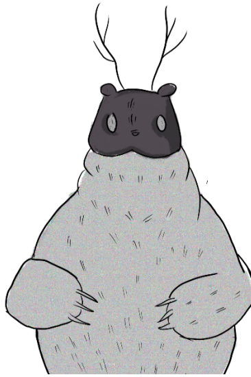
Figura 1. Él es Miedo

Ponerle una cara al miedo es importante no solo para la construcción de este proyecto, sino también, para ayudar a los niños y niñas a enfrentarlo. Todos los niños y niñas tratan de imaginar como son los monstruos que viven debajo de su cama; si es alto, si es flaco, si tiene un ojo o tres, si tiene garras o colmillos, porque es más fácil saber a qué se enfrentan cuando tiene una cara o forma. La idea del miedo dentro de nuestra cabeza puede ser una imagen en blanco, en negro, o un recuerdo de un momento determinado que se revive una y otra vez, pero toda idea va siempre acompañada de una imagen. La muerte puede ser una calavera, la felicidad puede ser un sol que da calor, la tristeza puede ser una lágrima, y, ¿el miedo?, el miedo siempre tendrá la imagen de lo que vivimos porque no hay una única forma de sentirlo ni una única cosa que lo provoque. Cualquier cosa puede dar miedo e incluso nada también. De esto surge la necesidad de ponerle una cara, una cara que los niños y niñas puedan asociar con lo que sienten y puedan verlo a los ojos y decirle: “ya no me asustas, ya no te tengo miedo”.