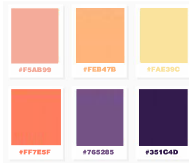
Figura 2. Paleta de colores con su código HEX

Una vez definida la estética y el personaje de la página web, se prosiguió a definir la voz con la cual Miedo se iba a dirigir a las personas que leyeran el contenido de la página. Si Miedo es un personaje, entonces Miedo tiene una voz y, por esto, la forma como se escribió el contenido de la página fue Miedo hablándole a los niños y niñas, como un amigo dando consejos y que quiere darse a conocer para ayudar a los que lo necesiten. En cada texto, Miedo trata de demostrar que su consejo es la mejor manera de enfrentarlo, y ¿cuál es su consejo?, no hay problema lo suficientemente grande o miedo lo suficientemente aterrador que no se pueda enfrentar y vencer con la imaginación. Cada libro y película que Miedo le recomienda a los niños y niñas tiene dentro un mensaje especial, sea con un papá alien, o comiendo renacuajos, o con un enorme león; la imaginación será siempre la clave para vencer a los villanos, no importa si esos villanos viven con los niños y niñas, o estudian con ellos, o si ese villano le quita algo que quiere, Miedo sabe y le promete a los niños y niñas con sus palabras que todo estará mejor cuando vuelven de su vida su propio cuento.