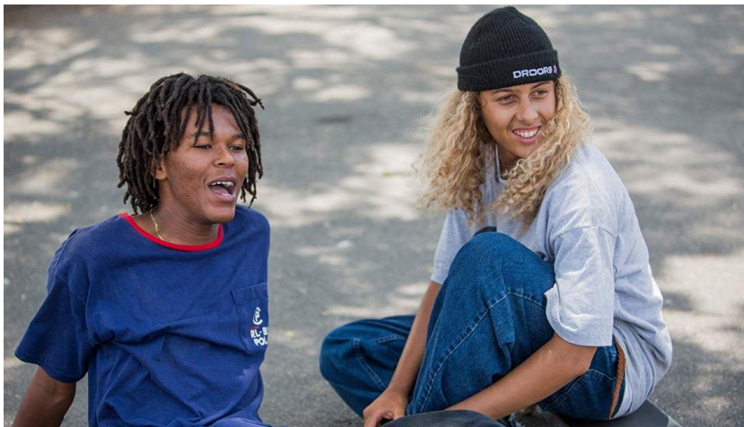
Rudin, S. Productor, Hill, J. Directora (2018) Mid90's . Estados Unidos, A24