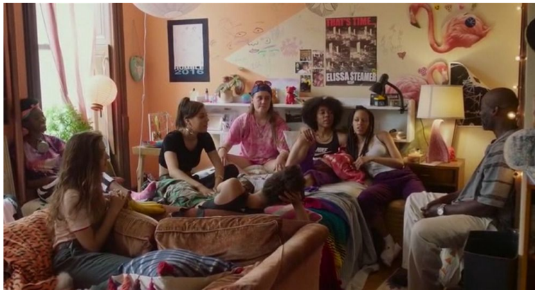
Moselle, C. Productor y director (2018) : Skate Kitchen . Estados Unidos