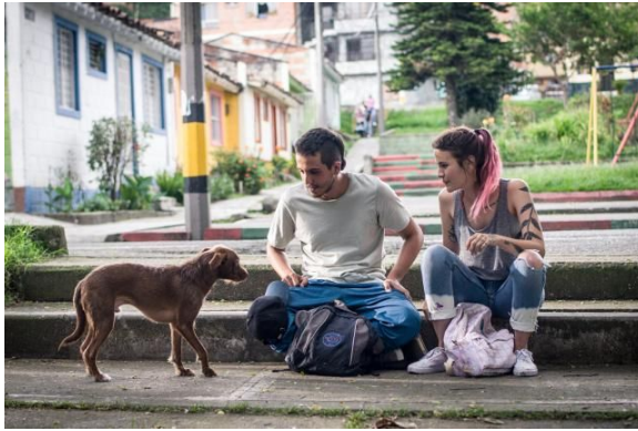
Guerrero, J. Productor, Arroyave, C. Directora (2019) Los días de la ballena . Colombia, amplitud, MadLove

A medida de que se genere conflicto entre los personajes, van a aumentar movimientos de cámara y menos estabilidad en los planos (Cámara al hombro), recurso característico del cine directo; como Jean Breschand señala en su libro la otra cara del cine que “la gran novedad de la cámara al hombro y del sonido sincrónico es la de poder incorporarse al acontecimiento filmado. La realidad no se recrea ante la cámara como una escena ante un espectador”. (Breschand, 2004). Este recurso de la cámara al hombro, se utilizará para crear tensión y desespero. Para esta parte de la historia se agregaran ángulos contrapicados y picados, para demostrar un poco las relaciones de poder entre los protagonistas, y aunque seguirán existiendo los planos generales, habrá más cantidad de planos medio y primeros planos, esto para poder retratar de mejor manera los sentimientos de los personajes.