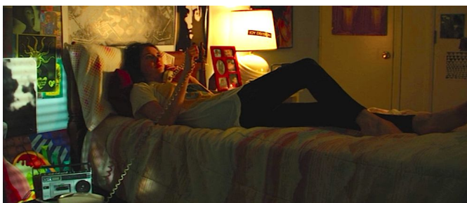
Araquí, G. Productor y director (2015) White Bird in a Blizzard . Estados Unidos, Francia: Why not productions

Para los interiores la iluminación será artificial, más específicamente para el cuarto de la protagonista, la iluminación tendrá luz cálida, pero resaltaron los colores vivos, esto para que represente un lugar tranquilo, seguro y muy pasional y de emociones fuerte.