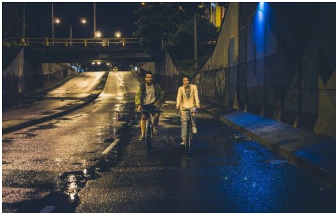
Guerrero, J. Productor, Arroyave, C. Directora (2019) Los días de la ballena . Colombia, amplitud, MadLove

Para los interiores la iluminación será artificial, más específicamente para el cuarto de la protagonista, la iluminación tendrá luz cálida, pero resaltaron los colores vivos, esto para que represente un lugar tranquilo, seguro y muy pasional y de emociones fuerte.