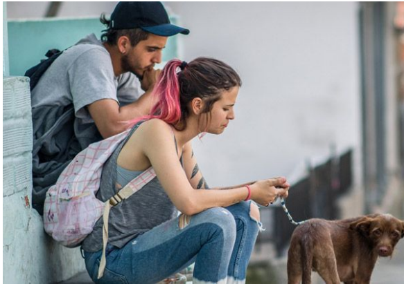
Guerrero, J. Productor, Arroyave, C. Directora (2019) Los días de la ballena . Colombia, amplitud, MadLove

exteriores se intentará dar un look natural, no muy iluminado, donde también resaltan los colores vivos, pero por cuestiones de locación se iluminará de manera artificial.