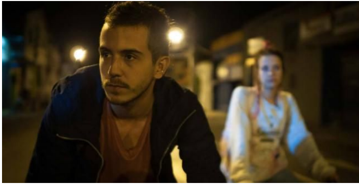
Guerrero, J. Productor, Arroyave, C. Directora (2019) Los días de la ballena . Colombia, amplitud, MadLove