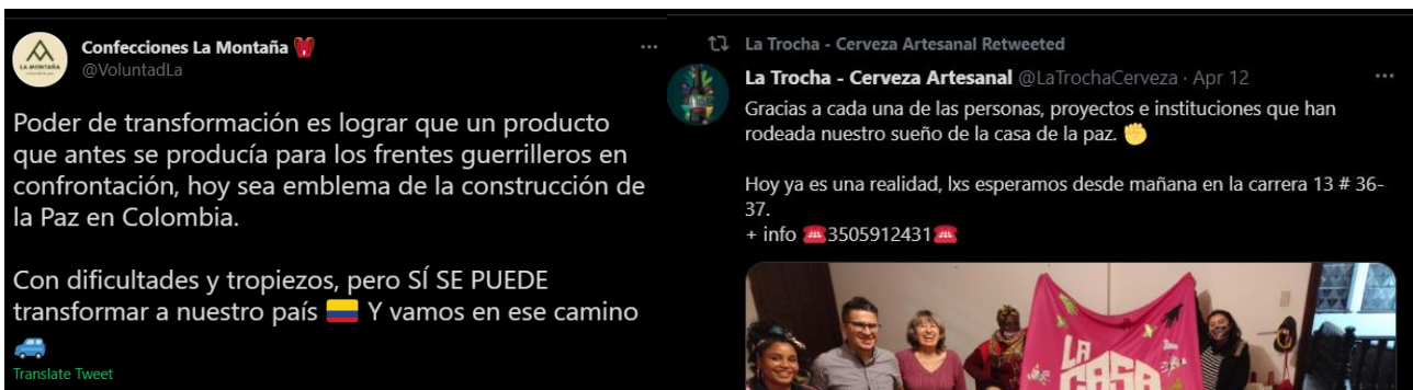
Publicaciones y narrativas sobre emancipación de Confecciones la Montaña Y La Trocha