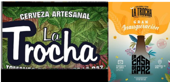
Publicaciones y narrativas de paz de La Trocha