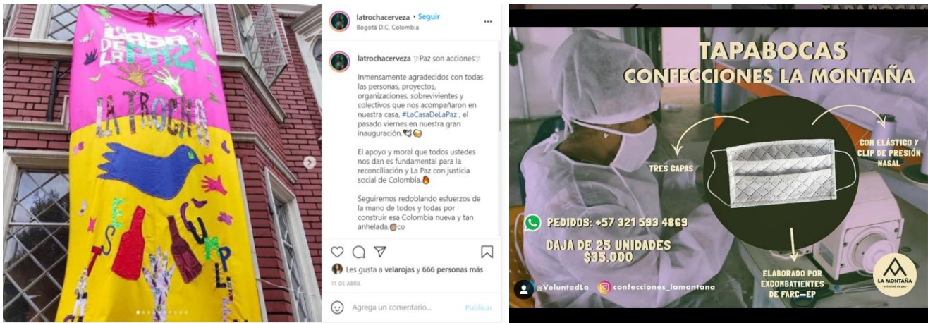
Publicaciones y narrativas de resiliencia de La Trocha y Confecciones la Montaña