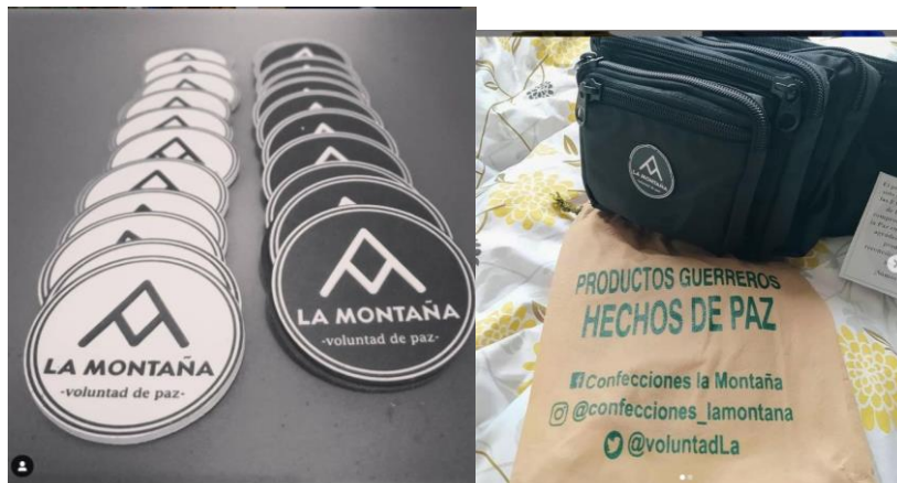
Publicaciones y narrativas de paz Confecciones La Montaña