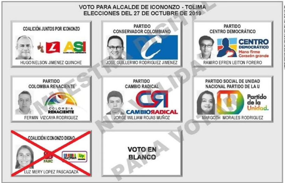
Tarjetón electoral elecciones alcaldía Icononzo 2019.