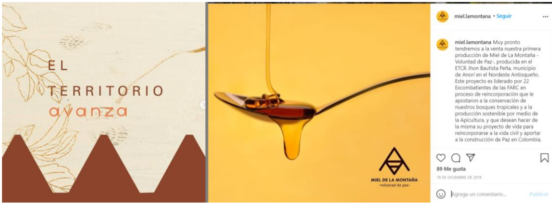
Publicaciones y narrativas del territorio en Tejiendo Paz y Miel de la Montaña