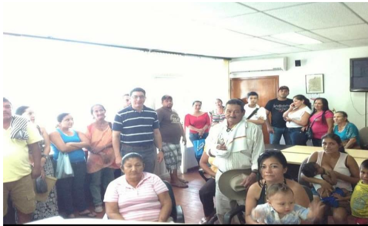
Serna, A. (2012). Actividad de atención al público [Fotografía].