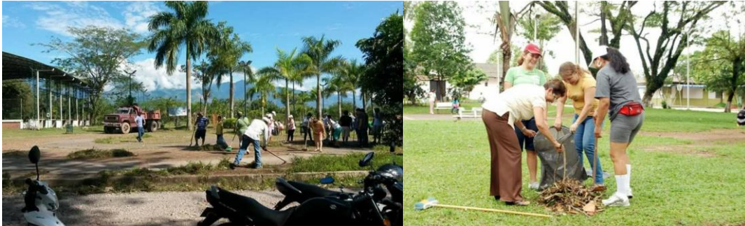
Serna, A. (2013). Ornato y embellecimiento del municipio [Fotografía].