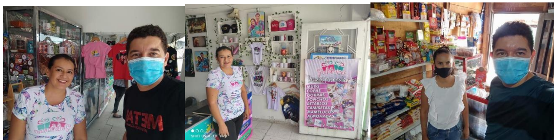
Serna, A. (2013). Beneficiarias en sus emprendimientos [Fotografía].