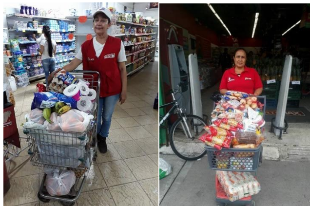
Serna, A. (2013). Beneficiarias haciendo uso del bono alimentario [Fotografía].