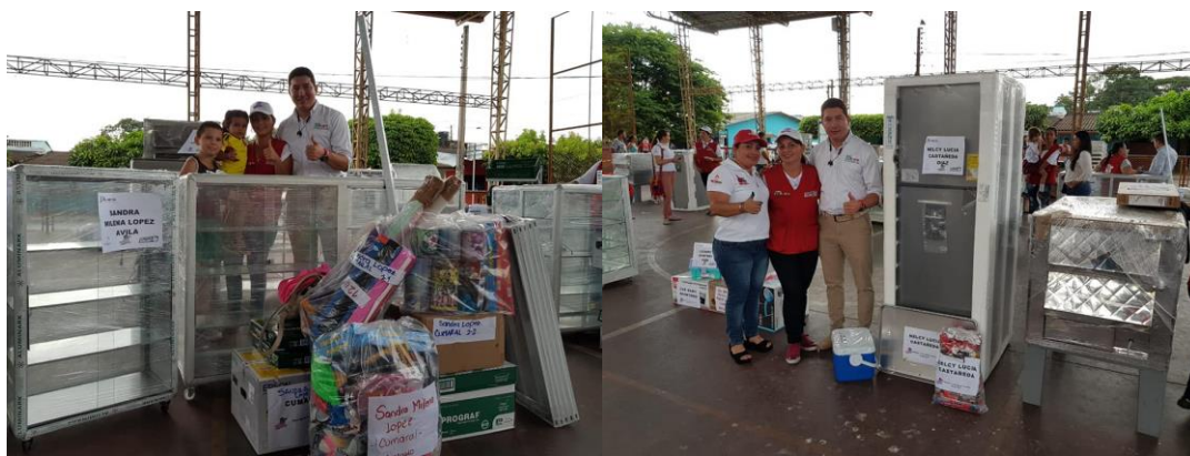
Serna, A. (2013). Beneficiarias recibiendo apoyo para sus emprendimientos [Fotografía].