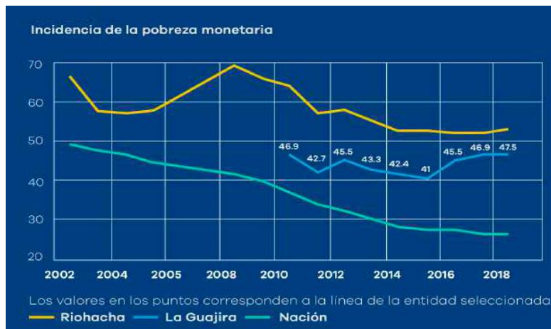
Incidencia de la Pobreza Monetaria de Riohacha

Nota. DANE & Alcaldía de Riohacha. (2019).