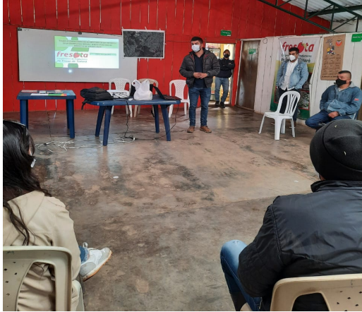
Figura 5. Presentación del equipo técnico