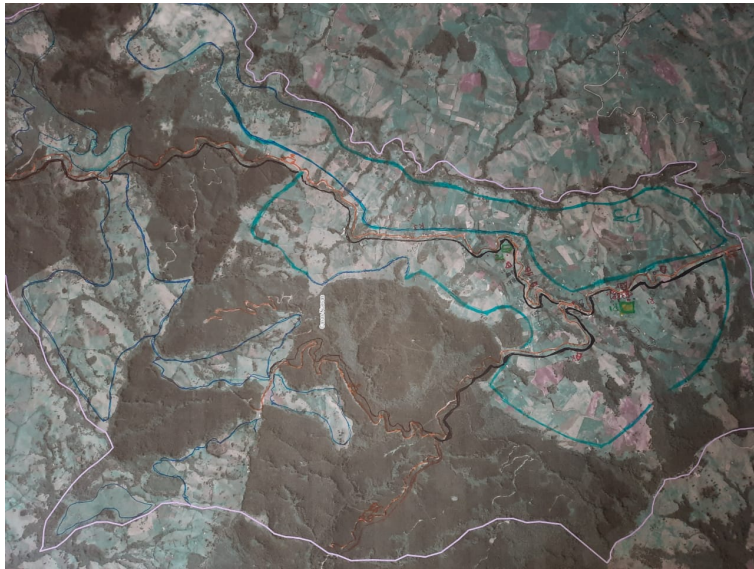
Figura 4. Mapa para el trabajo de cartografía social de acuerdo con las categorías que guiarán el taller y asignación de colores distintivos