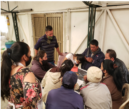
Figura 7. Desarrollo del Taller. Momento 1