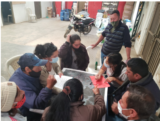
Figura 9. Desarrollo del Taller. Momento 3