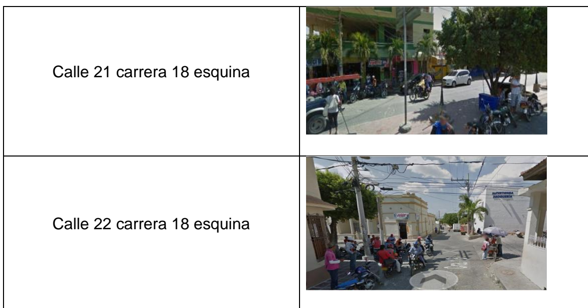
Cuadro 1. Estaciones arbitrarias dentro del casco urbano del municipio.