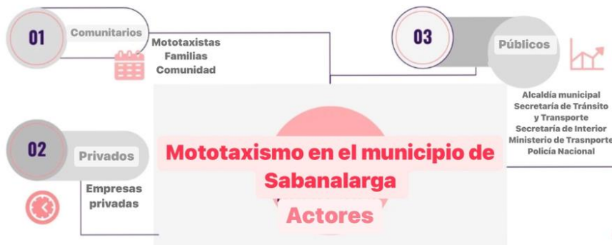
Imagen # 2. Mapeo de actores en el problema del mototaxismo en el municipio de Sabanalarga, Atlántico.

Teniendo en cuenta lo anterior, en la siguiente figura se expone todos estos actores que interactúan en el proceso del servicio público colectivo urbano en el municipio de Sabanalarga