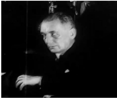
Imagen 10. Laureano Gómez. Político Conservador y Presidente de la República (1950-1951)