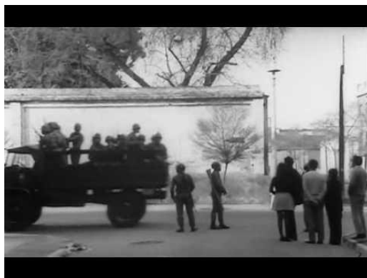
Imagen 2. Escena de “La Batalla de Chile”:

Imágenes del golpe de Estado del 11 de Septiembre de 1973.