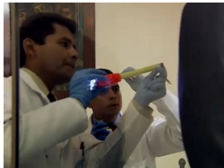
Imagen 6. Evidenciar una ausencia:

acercamiento hacia el pasado es asociado con un asunto criminalístico, convirtiéndose en una curiosa estrechez de manos entre la labor de los detectives con la de los historiadores propiciada por esta representación de lo ausente .