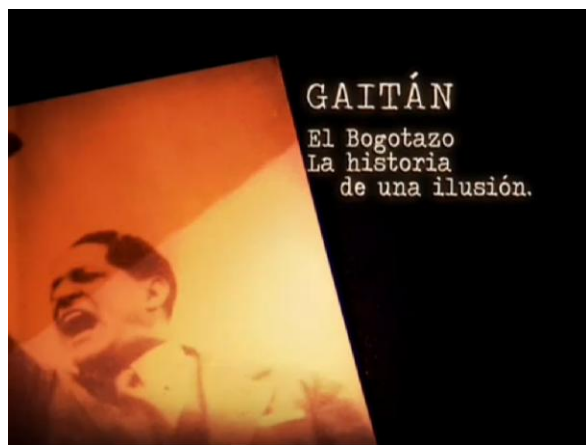
Imagen 3. Entrada de “El Bogotazo. La Historia de una Ilusión”

Este documental, pensado para la coyuntura del aniversario 60 del asesinato del político liberal Jorge Eliecer Gaitán (en 2008) tuvo una amplia difusión en uno de los canales de mayor audiencia de Colombia (Caracol TV) y que a su vez estaba pensado para una difusión internacional en Latinoamérica a través del canal multinacional History Channel. (Pertenece a la corporación norteamericana Discovery Networks). El Documental de una hora de duración, busca reconstruir mediante diferentes testimonios y enfoques (políticos, arquitectónicos, así como de tipo biográfico y personal) el suceso del 9 de Abril de 1948.