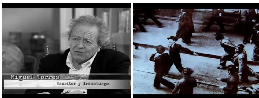
Imagen 8. Representación del perfil del asesino de Gaitán Roa Sierra. Articulación entre narrativa literaria y los personajes relacionados del hecho histórico.

oficial - que esclarezca los sucesos aun sin resolución. Una situación similar a lo que ocurre en las escenas finales de JFK, cuando el protagonista infiere que el asesinato de Kennedy debe ser esclarecido por las futuras generaciones como un ejercicio de pertinencia ética con la democracia y la sociedad estadounidense.