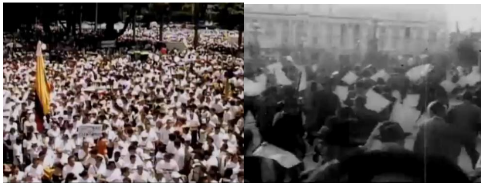
Imagen 5. Relación Presente-Pasado: 4 de febrero de 2008 / Marcha del Silencio 1948

Este tipo de relaciones, en las cuales se busca ilustrar el impacto del 9 de Abril, la importancia del personaje de Jorge Eliecer Gaitán como representante de un clamor de alto al fuego y la ejemplificación del conflicto colombiano mediante este tipo de secuencias, permiten pensar cómo esta producción se convierte en una fuente de recursos simbólicos sobre el pasado , mediante su naturaleza de contar un hecho y construir una “ realidad ”.