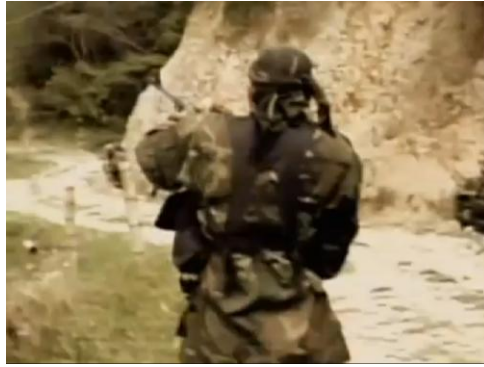
Imagen 4. Relación Presente-Pasado: Imagen de combate entre Ejército y grupos insurgentes en tiempo reciente. Reapropiación de imágenes hecha en el documental. 58