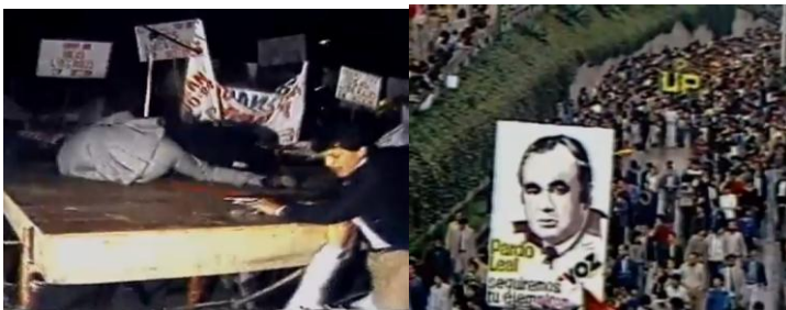
Imagen 14. Relaciones Presente-Pasado. Imágenes reapropiadas por el documental: Guerrillas liberales del llano en la década de 1950. FARC, en la década de 1990. Disturbios del Bogotazo, Atentado al edificio del DAS, (servicio de inteligencia nacional) en 1989. Asesinatos de líderes políticos: Luis Carlos Galán 1989, Jaime Pardo Leal 1987.

La construcción propiciada por el montaje de imágenes permite relacionar los hechos del 9 de Abril, como el inicio de una historia de violencia que atraviesa la vida colombiana de la segunda parte del siglo XX. La imagen aquí ejerce un poder simbólico muy fuerte, complementario al trabajo textual y la producción que presenta y representa la historia de Colombia como un proceso enteramente violento que atraviesa todas las ideologías políticas (sean de dirigentes Liberales o de línea de izquierdas en el caso de la imagen del sepelio del líder de la UP), o cómo el poder estatal se ve vulnerado por un atentado