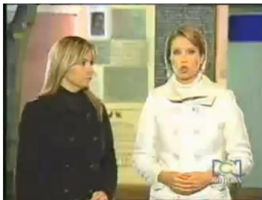
Imagen 20. Imágenes del especial de RCN Televisión “ El Bogotazo 60 años ”

Espectacularidad del suceso : presentadoras en el lugar donde fue asesinado Jorge Eliecer Gaitán