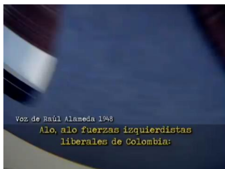
Imagen 19. Dramatización de la alocución radial por parte de los amotinados. En “El Bogotazo...”

De acuerdo con esta reflexión presentada, evidenciamos cómo la producción historiográfica textual, se articula y se une con la posibilidad de producir una historiografía a partir de la imagen, lo visual y lo audiovisual. Vemos cómo el interés por reconstruir un pasado a través de formatos audiovisuales, presenta un vínculo con toda una serie de construcciones culturales y unas perspectivas particulares de abordar los sucesos históricos que se han desarrollado por décadas tanto en la comunidad académica, cómo en el circuito de la producción televisiva. Esto nos demuestra la complejidad que implica el enfrentarse al reto