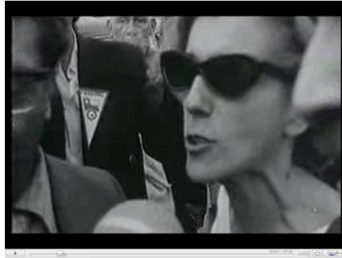
Imagen 1. Emotividad en “La Batalla de Chile” de Patricio Guzmán 32 : seguidora de los partidos políticos de la derecha Chilena antes de las elecciones de 1970 emite ante la cámara su aversión al socialismo y las vertientes de izquierda en Chile. La frase “comunistas asquerosos tiene que salir todos de Chile” es uno de los registros más singulares que aparecen en esta producción.

entra a jugar la forma y el talento del autor al construir una narrativa en su trabajo audiovisual, el cual resulta extensivo al momento de ubicarse dentro de una especificidad temática, en la que el documental se convierte en ese instrumento que posibilita la reproducción de un discurso a nivel Histórico .