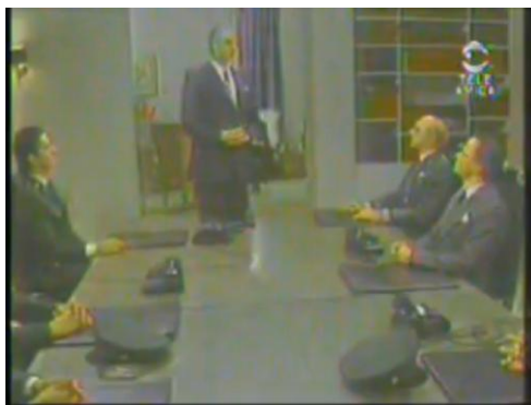
Imagen 17. “Escena de “El Bogotazo” en la serie Revivamos Nuestra Historia . 1984.

Este balance nos muestra en este caso, cómo algunos tipos de obras y producciones escritas sobre el bogotazo , funcionan casi como guiones de base para lograr un “montaje” visual sobre los hechos de la historia de Colombia, claro está, desde el terreno de la “ficción” o la “ficción histórica”. También, vale la pena llamar la atención en cómo en este caso, prevalecen los sucesos en interiores, (interiores de palacio) como si estuviésemos viendo el hecho desde el interior hacia afuera, creando la simulación en la cual el acontecimiento ocurre fuera de escena .