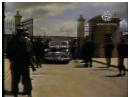
Imagen 16. “Escena de “El Bogotazo” en la serie Revivamos Nuestra Historia. 1984.

“Entré a Palacio por la puerta de la carrera Séptima en medio del tumulto que empezaba a formarse, compuesto principalmente por gentes que llegaban en taxis “Rojos” que lanzaban airadas frases y gritos, de los cuales yo alcanzaba a percibir las palabras “Gaitán” y “Partido Liberal” 99