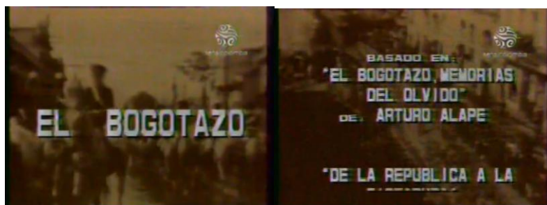
Imagen 15. Entrada de “El Bogotazo”. Serie de Televisión Realizada en 1984 por Jorge Ali Triana. PROMEC Televisión 96

Desde 1979 hasta 1986, la televisión pública colombiana (INRAVISION, por ese entonces) realizó una temporada de seriados titulada “Revivamos nuestra Historia” en la cual, se recreaban y adaptaban diferentes sucesos referidos a la Historia de Colombia. La serie, fue realizada por la programadora Promec , producida por el historiador Eduardo Lemaitre, los libretos de Carlos José Reyes (el mismo guionista de El Bogotazo, la historia de una ilusión ) y la dirección del reconocido productor televisivo Jorge Alí Triana.