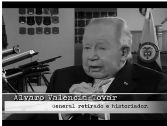
Imagen 11. General Retirado -e “Historiador”- Álvaro Valencia Tovar.

La imagen 11, constituye sin duda alguna, en una de las Representaciones con mayor carga simbólica e ideológica del testimonio y la versión de la historia que está ofreciendo una interpretación sobre el suceso. Álvaro Valencia Tovar, general retirado del ejército Colombiano, quien es presentado como “Historiador” debido a su actividad intelectual caracterizada por ofrecer una perspectiva histórica de las Fuerzas Miliars, interviene en el