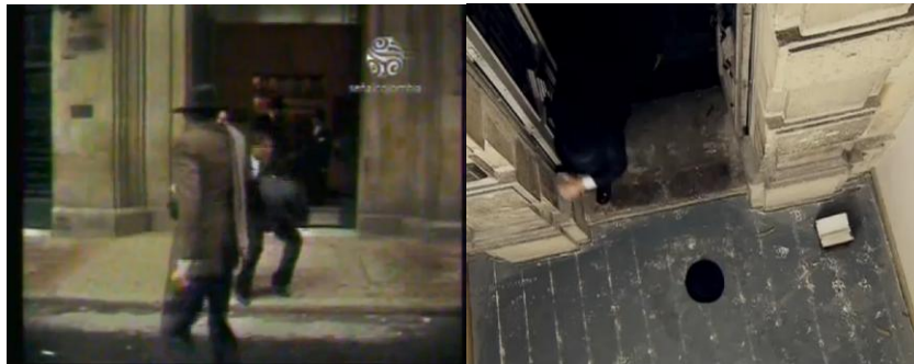
Imagen 18. Dramatización del asesinato de Gaitán en “Revivamos nuestra Historia” 1984. (izq)

Una de ellas es la forma en la cual el asesinato de Gaitán es representado en el documental (además de la recreación en 3-D y el estudio forense mencionado), como un acto fuera de escena , en el cual la condición epistemológica e historiográfica del documental permite hacer esas inferencias, algo que en el terreno de la ficción es pertinente hacer explícito.