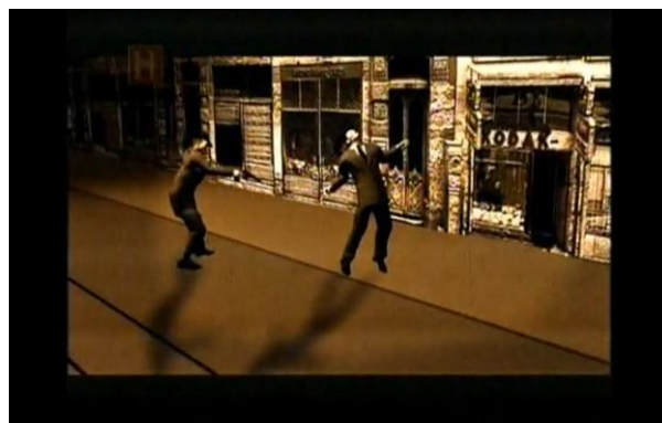
Imagen 7: Dramatización.

Secuencia del análisis balístico al traje de Jorge Eliecer Gaitán por parte de miembros de criminalística de la policía Nacional de Colombia en “El Bogotazo, la historia de una ilusión”