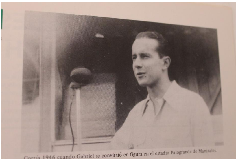
Narrando desde el estadio Palogrande de Manizales en 1946.