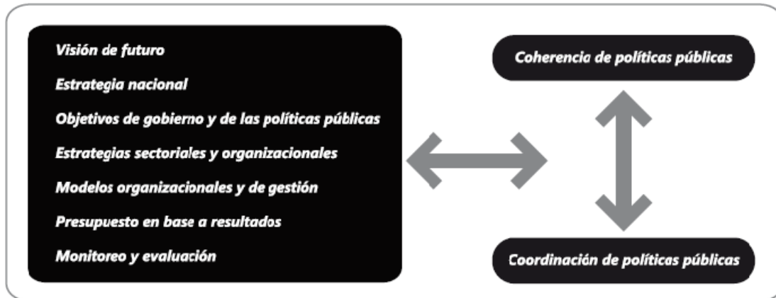
Figura 2. Instrumentos para la coherencia y coordinación