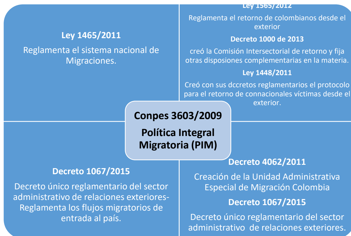
Figura 3. Política Integral Migratoria (PIM)

En el interés de la presente investigación nos detendremos en las disposiciones planteadas a partir de la política integral migratoria (PIM).