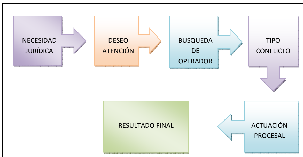
Figura 2. Proceso de acceso a la Justicia de Paz.