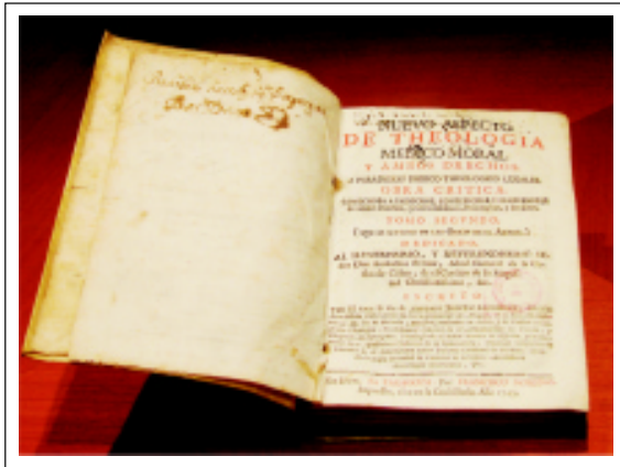
Figura 4. Rodríguez, Antonio José. Nuevo aspecto de la theologia medico moral, y ambos derechos; obra crítica provechosa a parochos, confessores y profesores de ambos derechos, y útil a médicos, filósofos y eruditos, 1745.