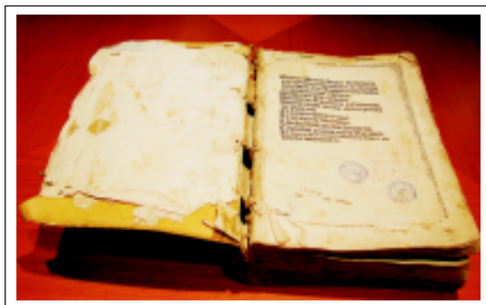
Figura 1. Mesue, Johannis. Canones universales divi Johannis Mesue, de consolatione medicinarum simplicium et correctionum carum, 1497.

Figura 2. Ruellio, Joanne. Pedanii Dioscoridis Anarzabei, de medicinale materia libri sex. Ioanne Ruellio suesessionensi interprete. Singulis cum stirpium tum animantium historiis, ultra millenarium numerum adiectis non sine multiplice peregrinatione sumptu maximo, studio atque diligentia singulari, ex diuersis regionibus conquisitis. Additis etiam annotationibus siue scholiis brevissimis quidem, quae tamen de medicinali materia omnem controversiam facile tollant, 1549.