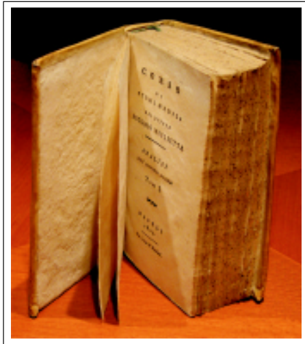
Figura 7. Miglietta, Antonio. Corso di studi medici, 1803.