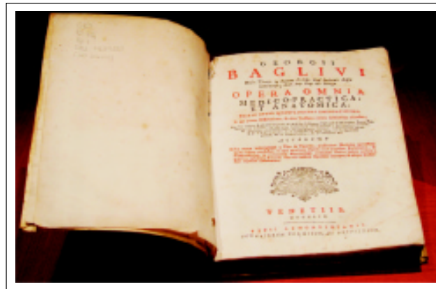
Figura 5. Baglivi, Giorgio. Opera omnia medico practica et anatomica, 1754.