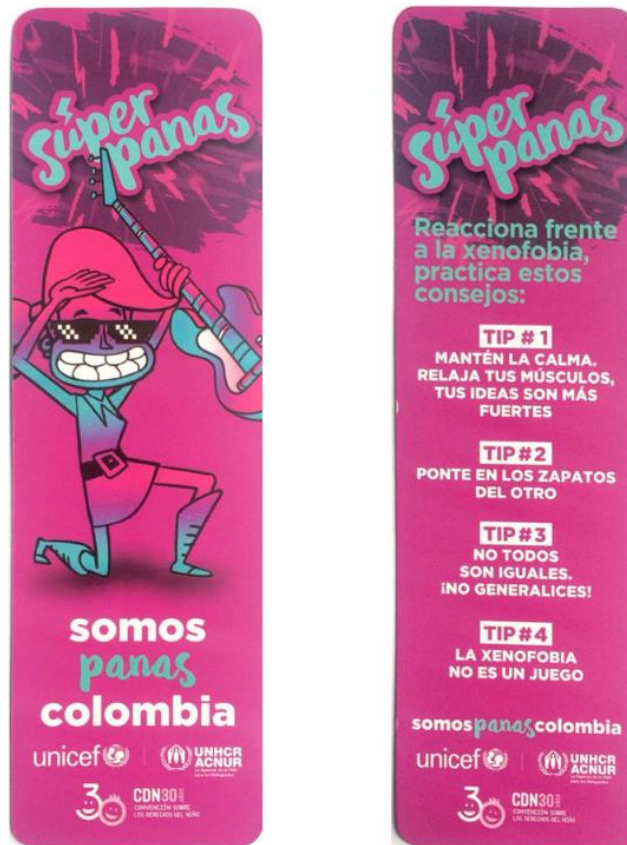
Figura 2. Súper Panas: destinado a población infantil receptora y migrante. Material suministrado por ACNUR en entrevista realizada.

Súper Panas tiene este kit para los niños, donde se les explica sobre la xenofobia y porque no es comportamiento apto. Asimismo, Súper Panas es parte de la estrategia de comunicación de ACNUR, siendo un contenido que busca profundizar sobre los efectos de la xenofobia en un grupo segmentado.