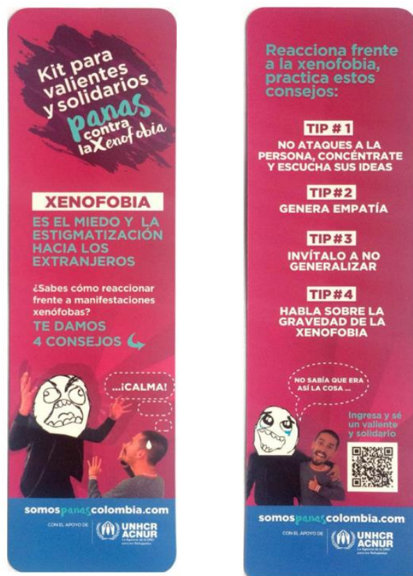
Figura 1. Kit para valientes y solidarios panas contra la Xenofobia: destinado a población receptora. Material suministrado por ACNUR en entrevista realizada.

Este es un kit de sensibilización especial para la población receptora de migrantes, da 4 pautas que ayudan a saber cómo reaccionar y que reflexionan sobre la gravedad de las conductas xenófobas.