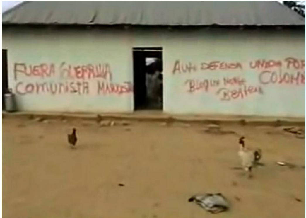
FUERA GUERRILLA COMUNISTA MARXISTA – AUTO DEFENSA UNIDA POR COLOMBIA BLOQUE NORTE BEATRIZ