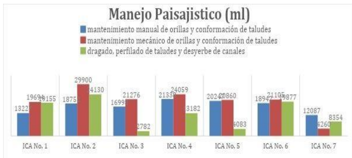
Gráfica 2. Cantidad (ml) de mantenimiento en manual de orillas y conformación de taludes en el Embalse El Muña y Colas

embalse, sin que se convierta en un proceso cíclico sin sentido que no erradique el problema de raíz.