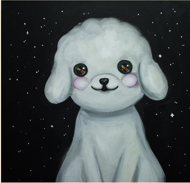
segunda pintura de la serie