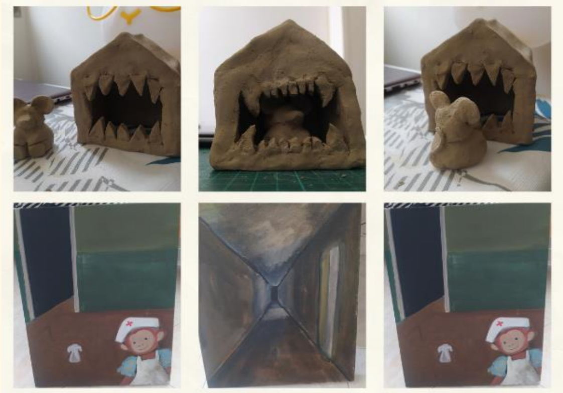
el miedo y los espacios liminales

En mi proceso me aventuré a pintar espacios liminales, lugares comunes, que, bajo otras luces, nos llegan a perturbar, por ejemplo, un espacio que debería estar abarrotado de personas, risas, charlas y en general un ambiente cálido. totalmente abandonado, comprendiendo nuevamente, irónicamente, que, para muchos, estos espacios que yo puedo ver como algo incómodo o extraño puede resultarles fascinantes. Es así como mis conceptos, incluso en el proceso de mi obra, se rompen con la interpretación del espectador; es un ciclo que no tiene fin y siempre, mientras haya dos partes interactuando, va a existir la convergencia y la divergencia. Eso es lo que siento que hace rico todo este proceso.