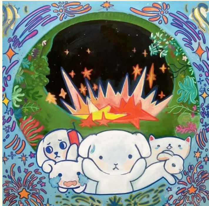
acercamientos a una serie concreta 1

inicié un proceso de experimentación pictórico en el cual pasé de utilizar el concepto del miedo, una paleta oscura y espacios perturbadores, a realizar retratos que expresaran mis fantasías por medio de mi simbología, una que había utilizado en trabajos de años anteriores pues aunque el terror fue un gran motor para el desarrollo de mi proyecto, siendo que es una forma de representar la inconformidad y la incertidumbre, decidí abrirme paso a algo que no fuera, “terrorífico” a la vista, sino que más bien fuera aterrador para los personajes que lo estaban viviendo, pues esto, de cierta manera, me representa.