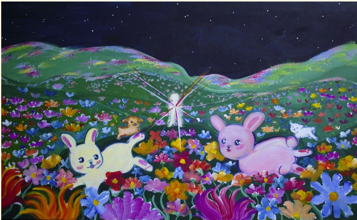
séptima pintura de la serie (final)