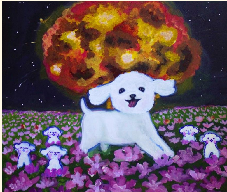
tercera pintura de la serie