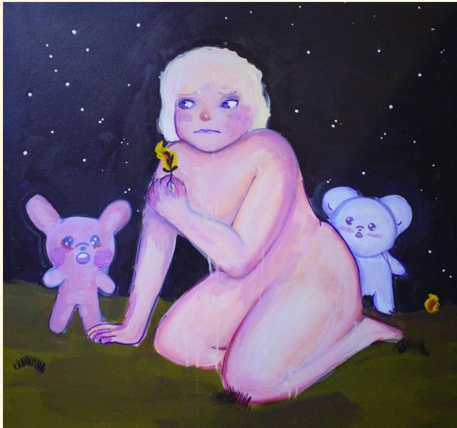
quinta pintura de la serie

Todo esto vuelve la experiencia de vivir un poco más amarga si no lo tomas de la forma correcta. Son emociones que no sabes manejar y crees que todo puede solucionarse fácilmente con un abrazo y un chocolate pues no dimensionas la complejidad de muchas situaciones.