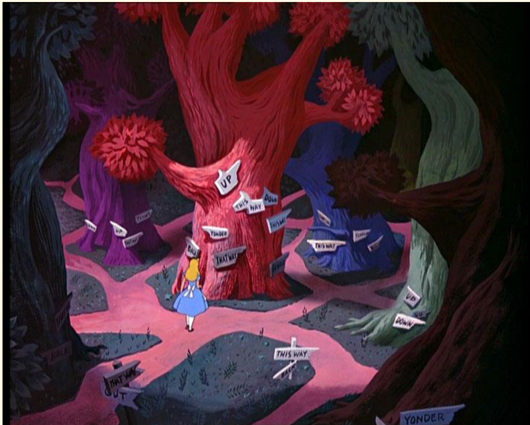
Alicia en el país de las maravillas, Fantasía/Musical, 1951

que se suponía que debía hacer, por donde debía empezar y por qué debía terminar. Sentía que el mundo me llevaba como la marea, no la podía controlar. No había letreros ni señas que me dijeran hacia dónde tenía que ir o cuál era la finalidad de todo esto. Así solo me dejé llevar en esta marea del mundo que consideré como un lugar hostil, pero ¿qué tan hostil?