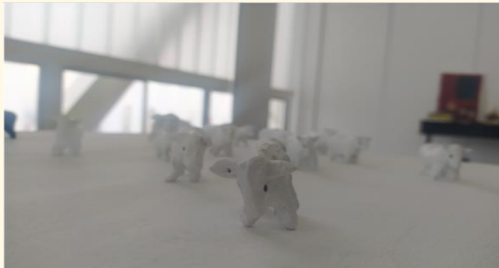
Masa, escultura de pequeña escala (Karen Andrade ,2021)

Me di cuenta de que estaba inmersa en una temática que, aunque me interesaba, carecía de una conexión personal profunda. Por ello, hice una transición hacia el tema de la ira, como la máscara del miedo. En particular, me interesaba cómo el miedo podía