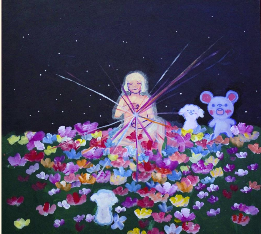
sexta pintura de la serie