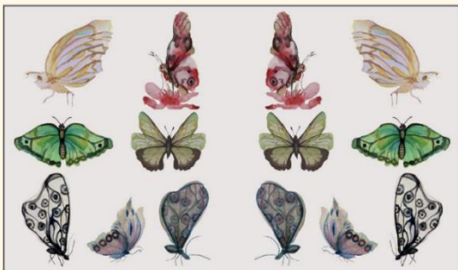
patrones, acuarela (Karen Andrade ,2019)

Inspirada por estas divisiones sociales, creé la obra "Patrones", una acuarela que retrata estereotipos difundidos mayormente en las redes sociales por una