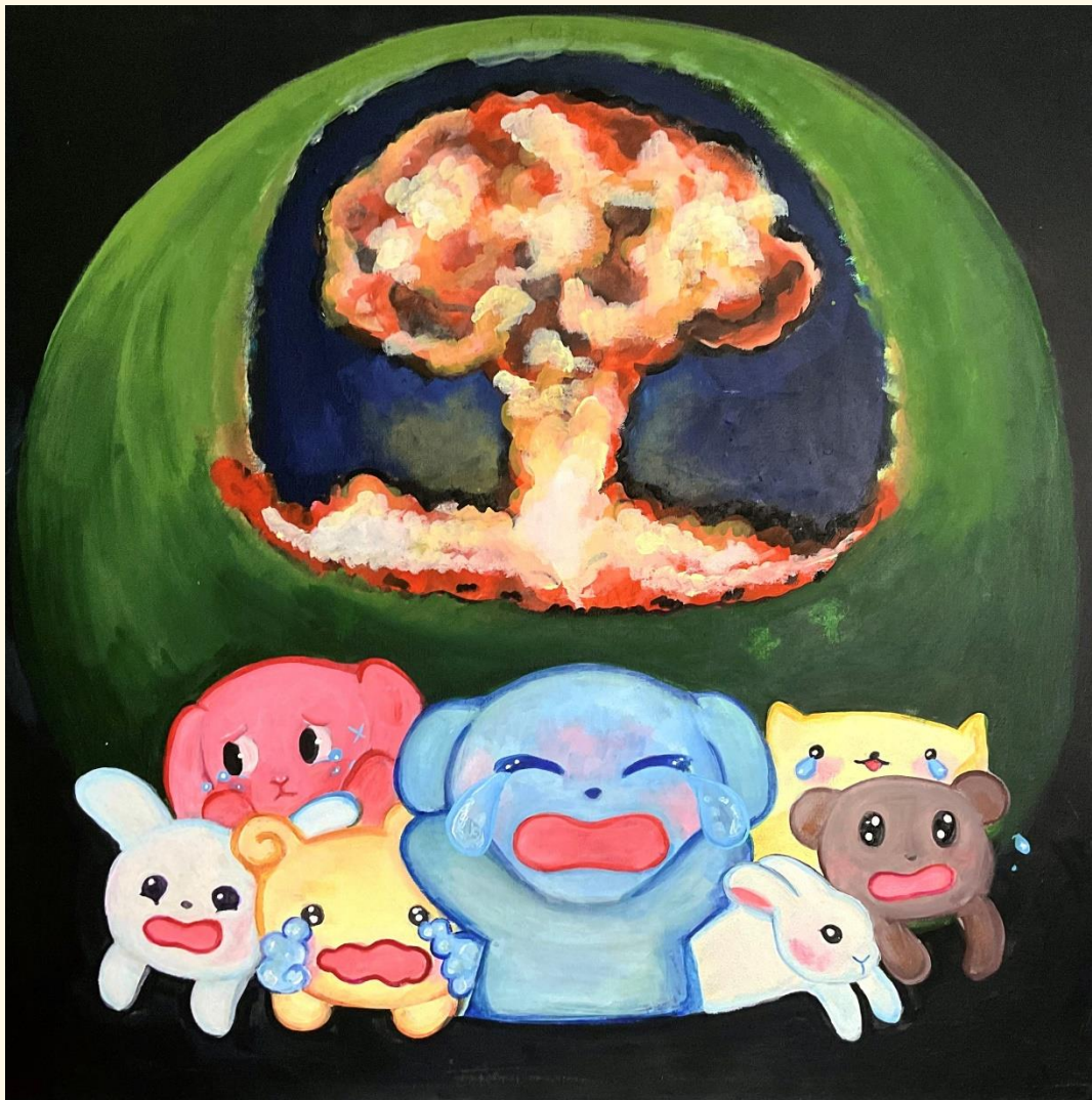
acercamientos a una serie concreta 3