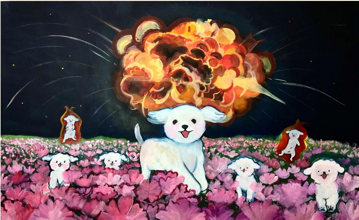
acercamientos a una serie concreta 2

Kant, Immanuel. "Crítica del Juicio" seguida de las observaciones sobre el asentimiento de lo bello y lo sublime. Editado por ALEJO GARCÍA MORENO, 1790, Páginas 77-78.