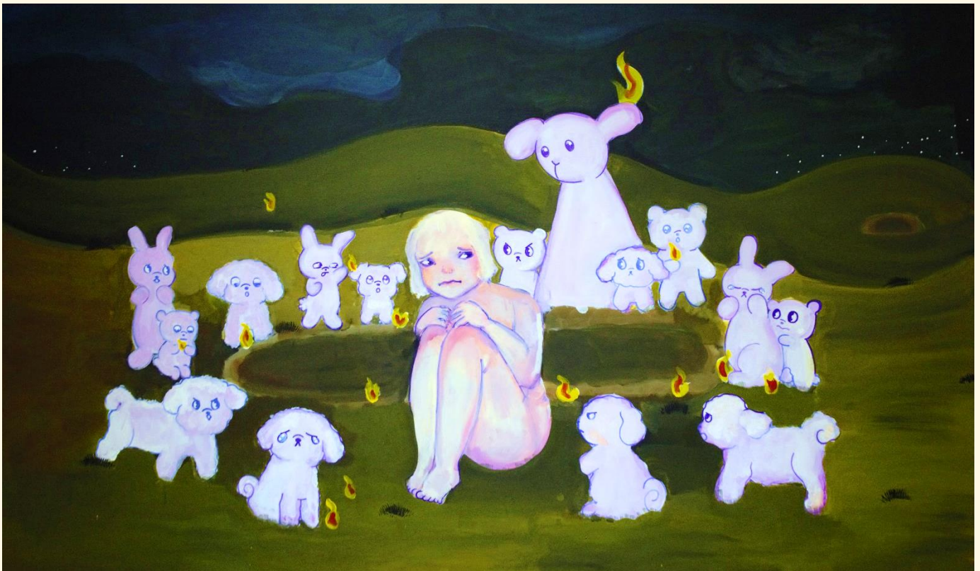
cuarta pintura de la serie

En un momento eres joven y de lo único de lo que te preocupas es de que tus papás no te descubran en medio de la noche viendo una de tus caricaturas favoritas, y en cuanto menos te das cuenta, los problemas de otras personas, empiezan poco a poco a salpicarte hasta que ya no puedes pensar en otra cosa. Invaden tu mente y piensas en cómo solucionar cualquier problema, incluso puedes llegar a pensar que tú mismo, de alguna manera, lo causaste.