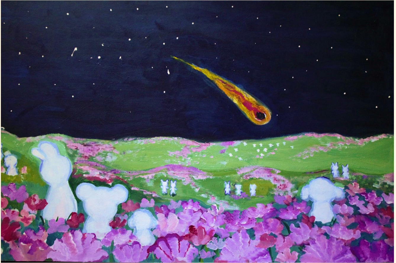
primera pintura de la serie