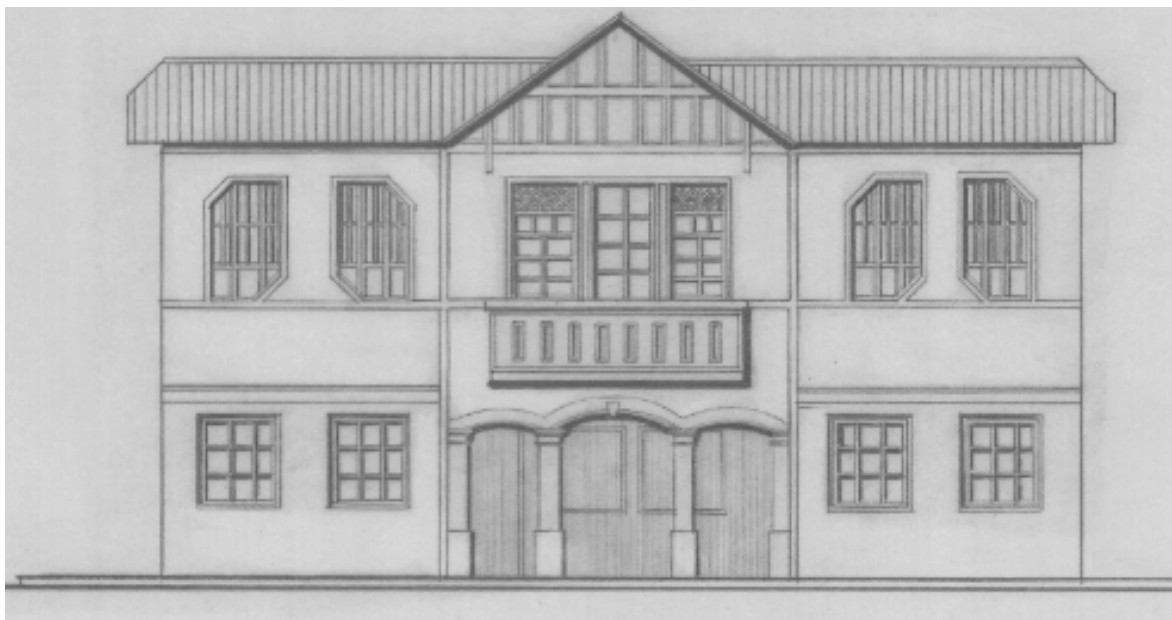
Imagen 1 17

Una de estas estaciones en situación de deterioro es la estación del Ferrocarril de Simijaca, en el municipio de Simijaca, departamento de Cundinamarca: Esta edificación fue construida en la década de los 40 15 , y estuvo en uso hasta finales de los años 90, al inicio del fin del sistema ferroviario. La estación de Simijaca se localiza en la zona rural del municipio, específicamente al nor-orienté del casco urbano, hacía parte de la línea la CARO- BARBOSA y se encuentra a la altura del kilómetro 144 16 .