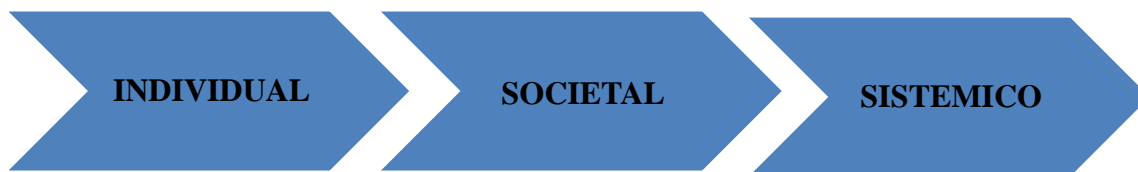
Figura No. 2

Allí, las capacidades ciudadanas son habilidades que las niñas, niños y jóvenes desarrollan de manera horizontal o paralela en los ámbitos de acción individual, societal y sistémico, que le permiten hacer parte del entorno social como actor que busca alcanzar transformaciones por el bienestar, la equidad y la justicia de la comunidad. Las dos propuestas plantean un perfil de ciudadano reflexivo, participativo, crítico y transformador del contexto social en el que vive; a partir del desarrollo de habilidades que adquiere en la escuela desde el reconocimiento de sí mismo y del otro.