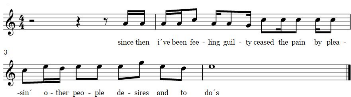
Figura No. 7 Ritmo en Meet Me At The Station

En este caso el texto tiene su ritmo implícito y sugiere mucha síncopas, y semicorcheas.