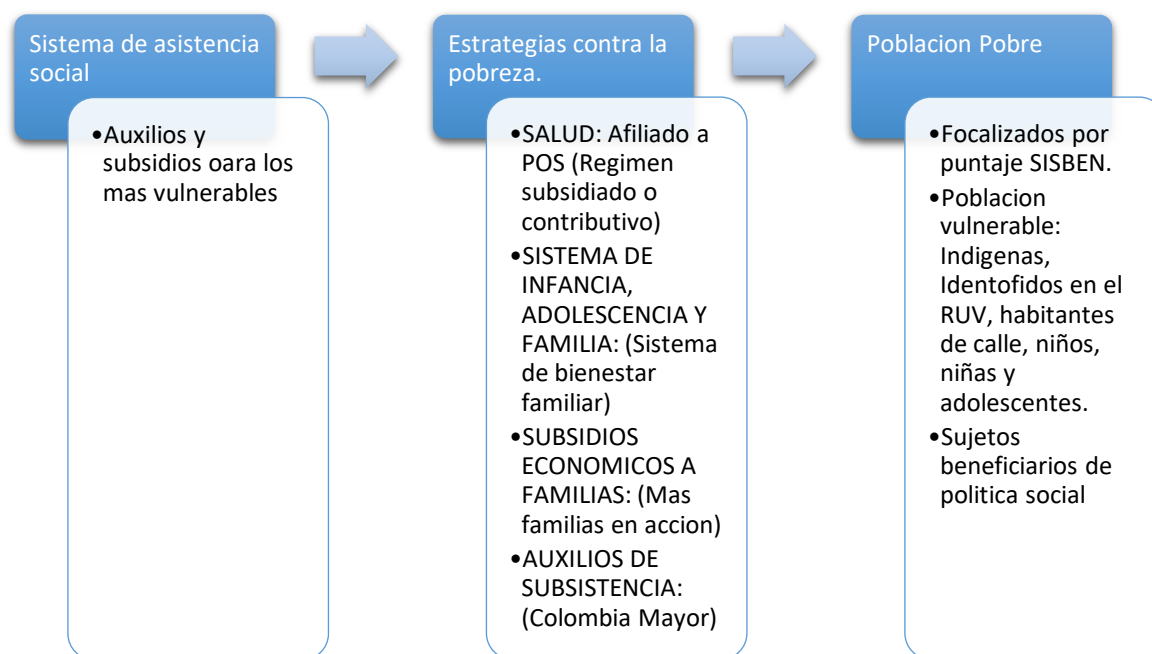
GRAFICO 1. Estrategias para la superación de la pobreza de acuerdo al sistema de asistencia social.