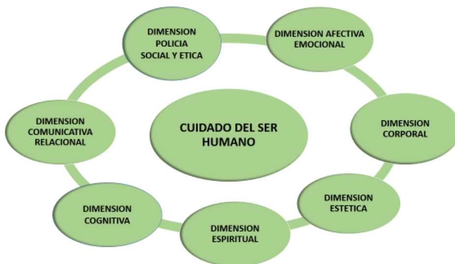
FIGURA 5 DIMENSIONES DEL CUIDADO EN EL SER HUMANO