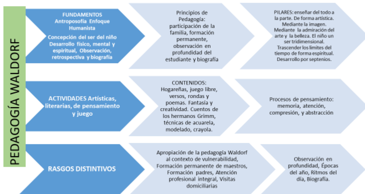
FIGURA 1 ELEMENTOS CONCEPTUALES