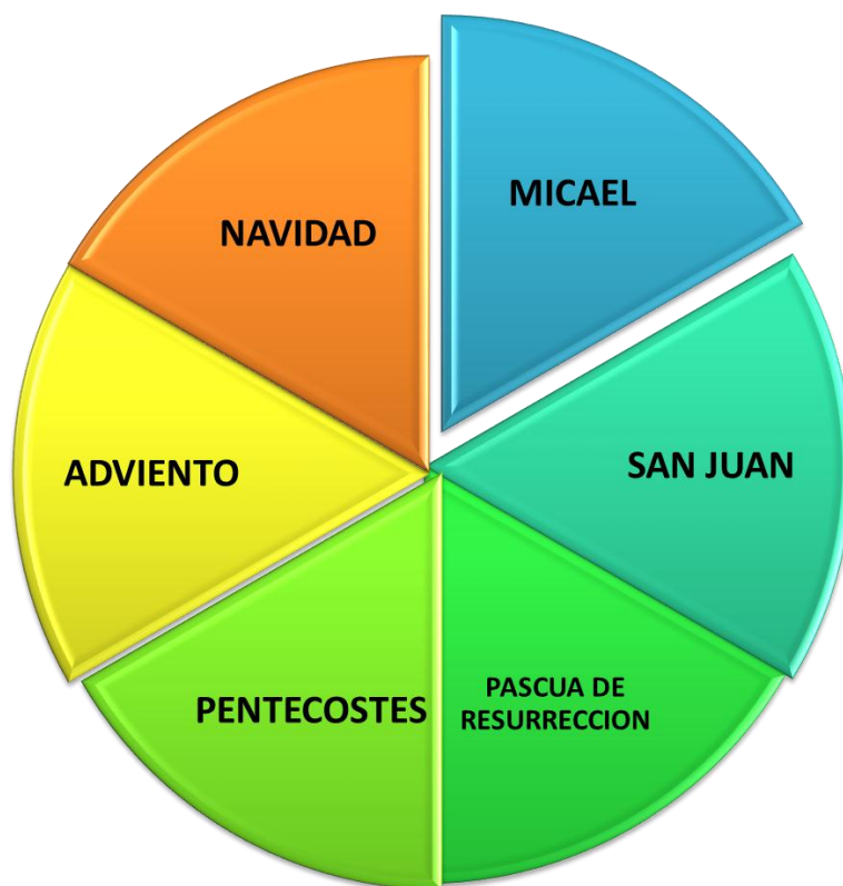
FIGURA 4 AÑO CRISTIANO