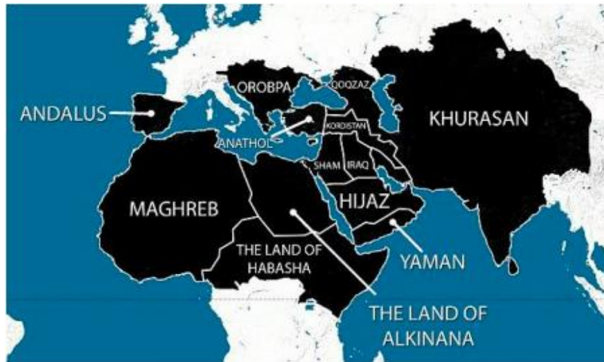
Mapa 2: Estrategia de expansión territorial de ISIS en un plazo de cinco años

Hall, J. (2014). en: "The ISIS map of the world", The Daily Mail. http://goo.gl/cQePiP