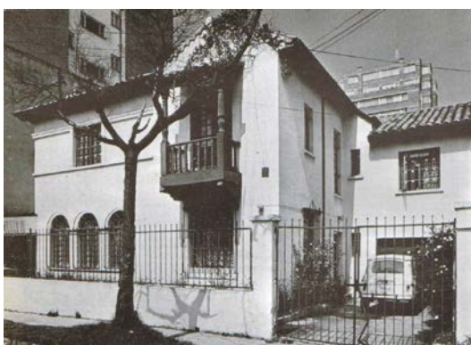
Casa Serrano en Chapinero