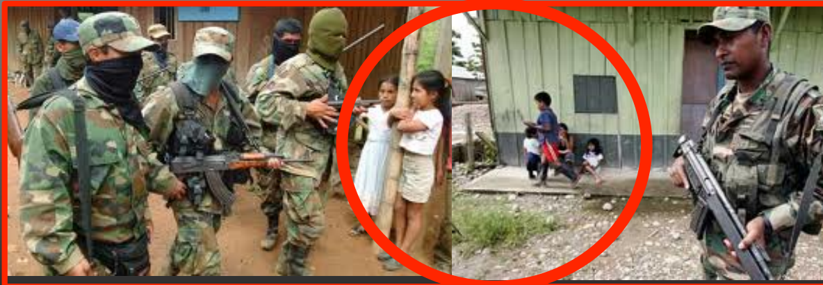
Ante amenazas de lado y lado la población civil se convierten en las piezas del juego

Asistencialismo estatal: esos peligrosos pañitos de agua tibia. Por Guillermo León Pantoja. Tomado de: http://samericanoticias.com/opinion/opinion/500-asistencialismo-estatal-esos-peligrosos-panitos-de-agua-tibia-.html . 20 de Junio de 2010