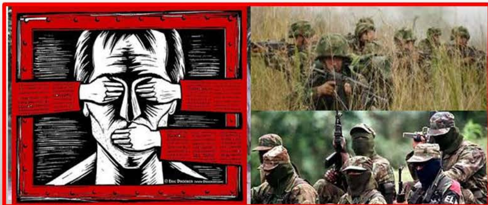
Ocultar la realidad