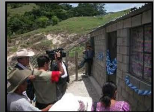
Soluciones inmediatas aportan pero tal vez se necesitan proyectos de mayor impacto