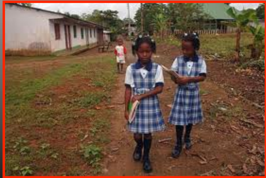
Debil de presencia estatal