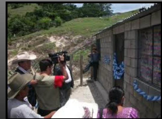
Soluciones inmediatas aportan pero tal vez se necesitan proyectos de mayor impacto