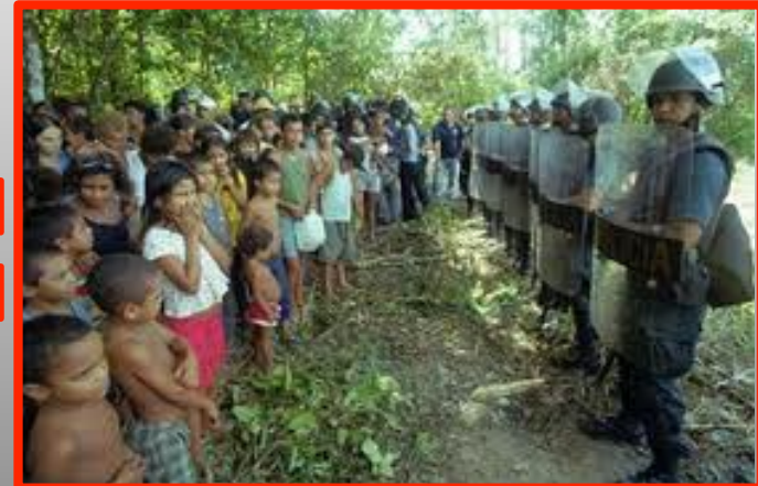
Población civil vulnerable en medio del conflicto es la víctima

“Estamos convencidos de que el conflicto no tiene solución por la vía armada. Este tipo de conflictos jamás se solucionan militarmente. No ha ocurrido en ningún lugar del mundo, menos aquí en Colombia, donde existen elementos como la presencia del narcotráfico, que hacen que el conflicto sea inacabable”, afirmó el Prelado en declaraciones al diario El Tiempo.