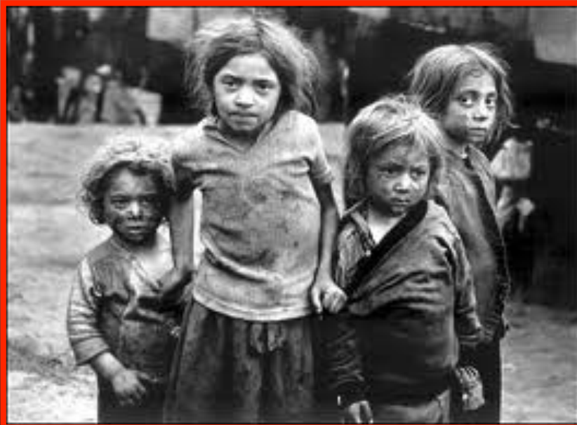
Inequidad, Injusticia Social

G. Petro: "El principal problema de Colombia es la inequidad social, la injusticia"