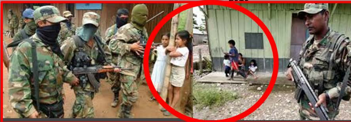
Ante amenazas de lado y lado la población civil se convierten en las piezas del juego

Asistencialismo estatal: esos peligrosos pañitos de agua tibia. Por Guillermo León Pantoja. Tomado de: http://samericanoticias.com/opinion/opinion/500-asistencialismo-estatal-esos-peligrosos-panitos-de-agua-tibia.html . 20 de Junio de 2010