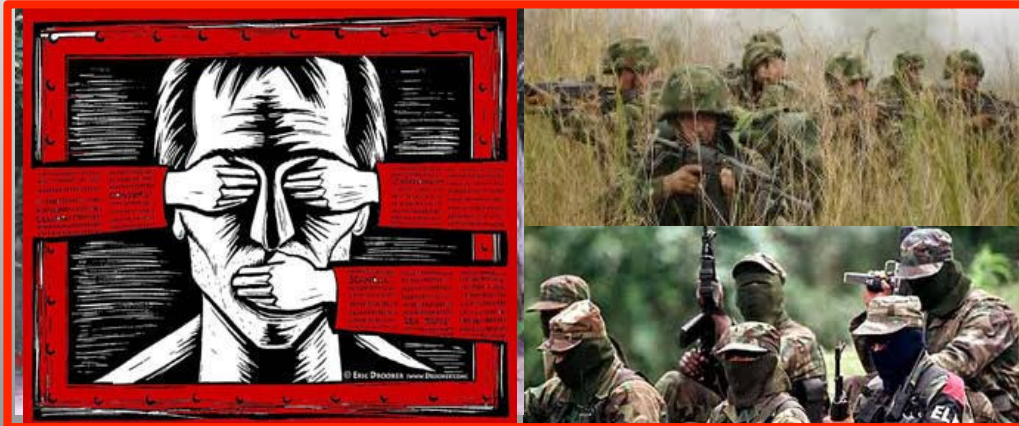
Ocultar la realidad