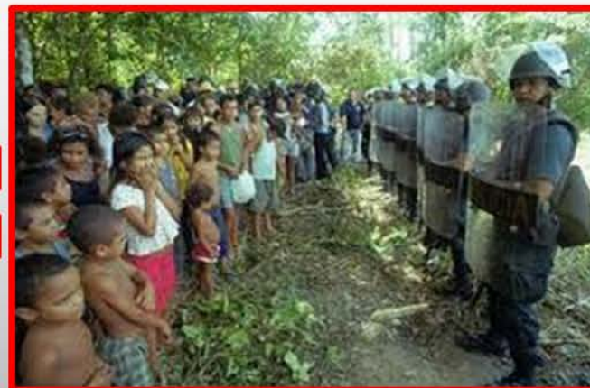
Población civil vulnerable en medio del conflicto es la víctima

“Estamos convencidos de que el conflicto no tiene solución por la vía armada. Este tipo de conflictos jamás se solucionan militarmente. No ha ocurrido en ningún lugar del mundo, menos aquí en Colombia, donde existen elementos como la presencia del narcotráfico, que hacen que el conflicto sea inacabable”, afirmó el Prelado en declaraciones al diario El Tiempo.