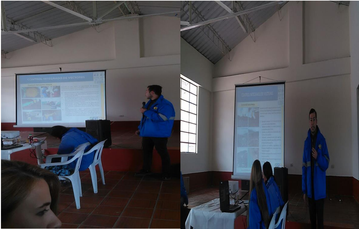
Foto 3. Recicladores en el Colegio Distrital de Mochuelo Alto, realizando la separación de Residuos Sólidos