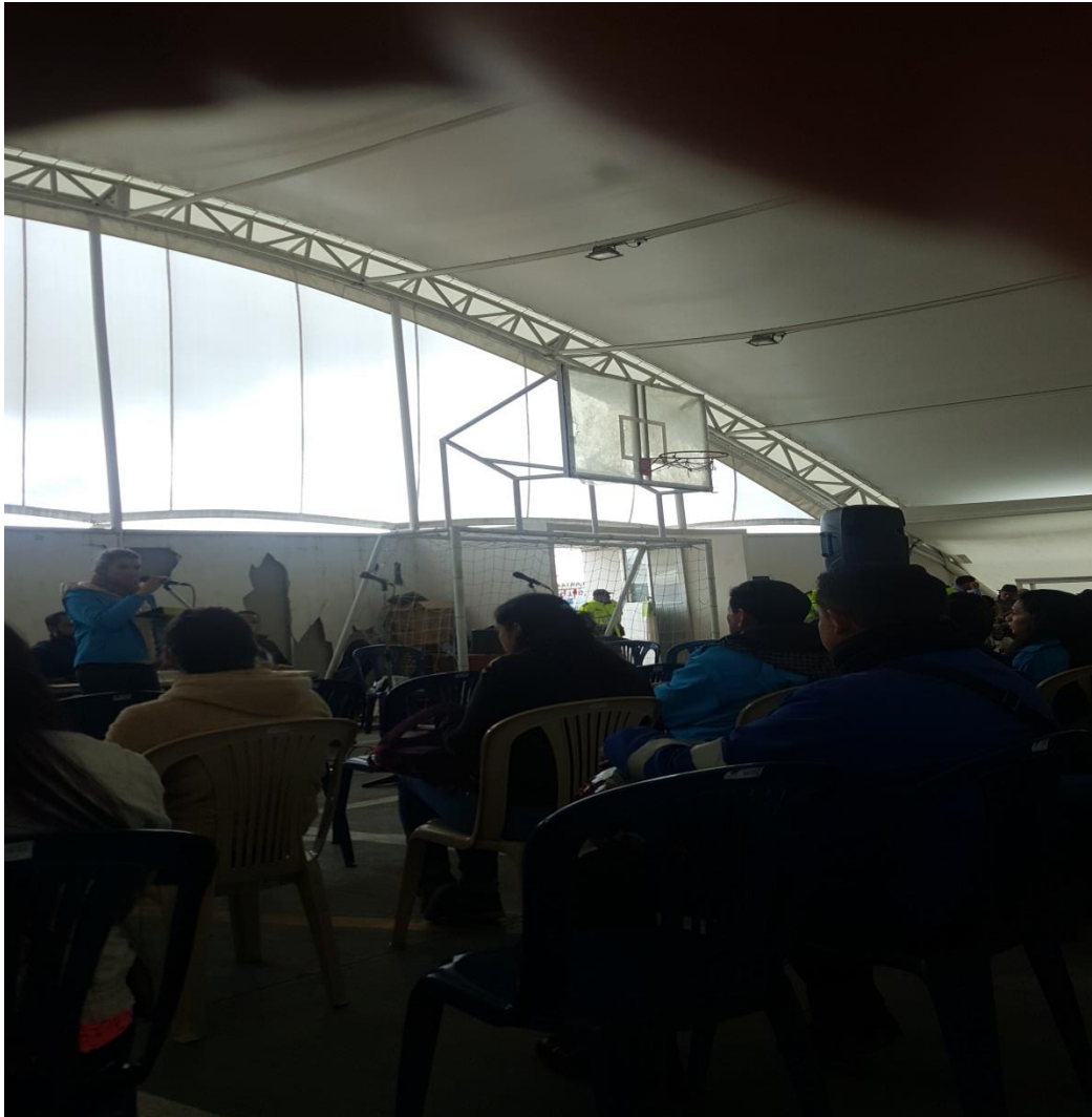
Foto 2. Proceso de Rendición de Cuentas realizado por el Centro de Gerenciamiento del Relleno Sanitario Doña Juana (CGR) en la Vereda de Mochuelo Alto