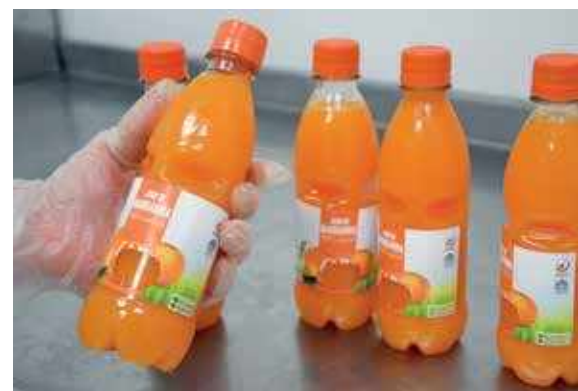
↑ Los jugos de mandarina y naranja que se encuentran en las cafeterías de la Universidad, son 100% de fruta.

Semanalmente se provee entre una tonelada y media y dos de sus productos