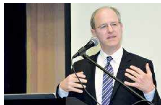
↑ Chuck Marr, director de la Política federal tributaria en el Centro de prioridades y presupuestales de Estados Unidos.

Desde el 2002, año en el que comenzó el Centro de política tributaria, han construido diferentes modelos sobre los impuestos en Estados Unidos. Estos modelos permiten entender, por ejemplo, cómo funciona la declaración de renta, el impuesto de renta y cómo puede cambiar mostrando la conexión entre dos o más variables. "Tenemos las cifras para decir si algo es bueno o malo y que no sea solo una opinión", explicó Burman.