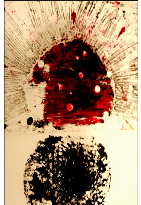
Detalle de un retazo

“Coso para fundir, corto para contemplar, para visualizar mejor y vuelvo a coser para estructurar y percibir de otra manera, para ordenar... Hago un paréntesis, pienso. Hay un hilo que reemplaza mi escritura temerosa y es rojo. Hay repetición y agujeros que demarcan y por los que entra luz. Intento guiarme y al mismo tiempo perderme para fusionarme con mi universo”.