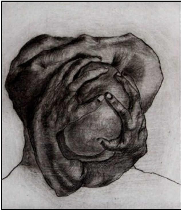
“Entre tus manos” 2009