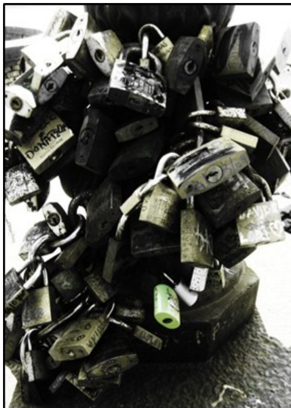
Serie de fotografías “La madre”

Tras mucho ahondar y construir conexiones se fue asomando la figura de mi madre, quien siempre había estado presente pero yo no me decidía a involucrar. Apareció insistentemente en diversas notas y frases hasta que me propuse asumirlo y pensar acerca de esto, acerca de nuestra relación de sinceridad e hipocresía, de amor, de apego, de odio, de extremos, de reclamos, de madre protectora y esclavizada y de hija resignada y sumisa. En mi hogar, el matriarcado fue una realidad, mi madre no sólo ha sido jefe máximo sino también guía, vigilante, juez, instructora, ha sido un ser polifacético definitivo en mí. Su autoridad me ha marcado, su sufrimiento me ha conmovido, pero el uso de su poder me ha desilusionado. Me ha intimidado porque se lo he permitido, de ahí surge mi “paura”.