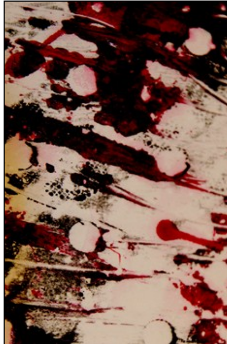
Detalle de un retazo

El tejer lo trabajo no sólo para unir, vincular, entrelazar esos retazos sino para seguir en conversación con esos miedos, su acción aparentemente inocente implica un proceso contemplativo, repetitivo, lento, que me ha llevado al ensimismamiento, a la observación, a la construcción de pensamiento y a resolver ideas. Las maneras de hilvanar son diversas y sobre la marcha las fibras naturales desaparecieron para decidir las uniones usando nylon, alambre e hilo grueso. La estructura es ligera, pero al mismo tiempo inquebrantable y se compone de retazos de mi.