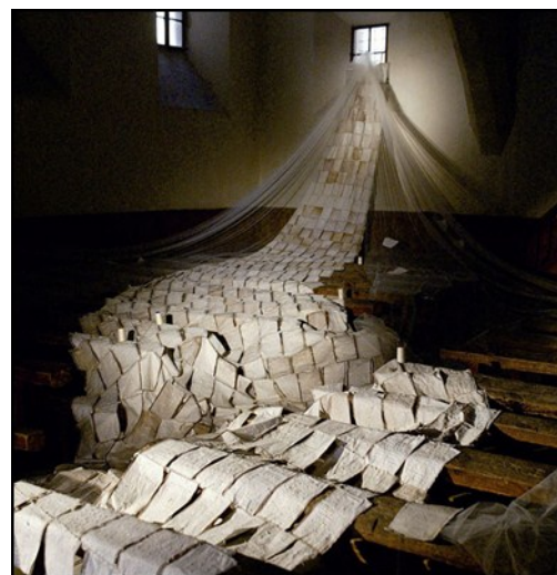
"Cartas a la madre" 1991

"Es como si el papel fuera una extensión de mi piel. Son las rasgadas de mi vida. Pero lo que me interesaba era el proceso de curación, el hilo que cura las heridas"