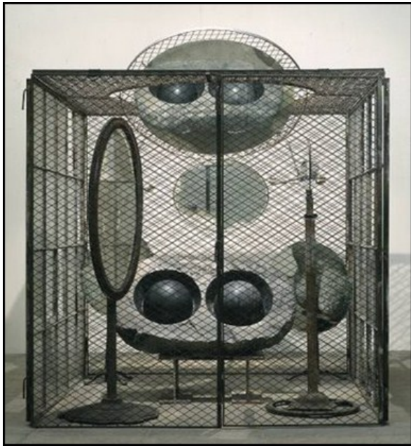
"Cell (Eyes and Mirrors)" 1989

Su obra Cell (Eyes and Mirrors), es una instalación en la que aborda nuevamente el tejido de recuerdos en una propuesta aún más simbólica, una estructura cargada de elementos oníricos. La celda es al mismo tiempo aislamiento y recogimiento, el espejo y el mirar corresponden al reflejo de uno mismo. Para realizar sus obras se internaba en los "corredores de la memoria" donde permanecen las repressions, el dolor, el resentimiento, el miedo, la culpa, la venganza.