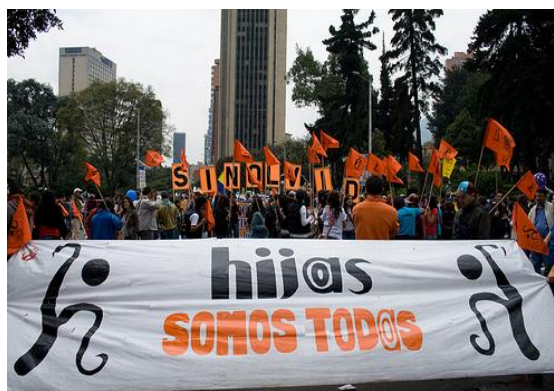
Foto i. de hijos e hijas en marcha del 1º de mayo 2008.

Ante un sentimiento gratificante por las acciones realizadas, hijos e hijas por la memoria y contra la impunidad decidió hacer un lanzamiento público para consolidar todos los caminos que habían emprendido (con pequeñas salidas y con las tertulias). Y para el lanzamiento, ya la estética del movimiento había cambiado: se definió un logo que desarrollo un grupo de amigos cercanos llamados Mefisto 21 (cambiando el signo de “los puntos”), y se cambió el color negro tomándose el naranja, para unos porque era un color diferente al de otras iniciativas -se vetaron rápidamente el rojo, azul y amarillo- (Entrevista 8), para otros como una metáfora de los colores del amanecer y el atardecer (Entrevista 10), y para otros por tratarse de un color alegre y que refleja el tipo de trabajo de memoria que hace el movimiento (Entrevista 1).